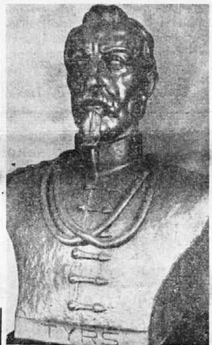
Bista Miroslava Tirša

Naš brat, Drago Orlandini, akademski vajar i član Sokolskog društva u Sinju, izradio je lepu bistu velikog osnivača Sokolstva, Miroslava