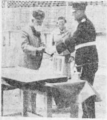
Izlasnik Nj. V. Kralja predaje Kraljev Mač br. Dr. Gavrančiču

grad sa 9,60; 2) Ljubljana sa 9,00 i 3) Ljubljana II sa 8,50 bodova.