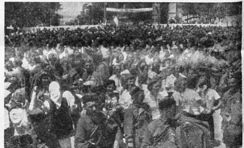
Sa sleta u Sušaku: Sokoli i građanstvo slušaju govore starešina primorskih župa

Ministar poljoprivrede odobrio je veći broj pomoći raznim ustanovama, u cilju unapređivanja biljne proizvodnje. Među ostalima odobreno je Savezu Sokola Kraljevine Jugoslavije 20.000 dinara, kao pomoć za unapređenje voćarstva na selu preko Sokolskih četa.