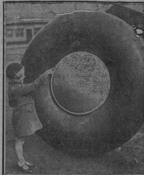
Ogromen obroč iz gumija za kolo holandskega potniškega letala.

Hotiza. »Odrpta noč in dan so groba vrata«. Pretekli teden je umrla hčerka znane gostil-