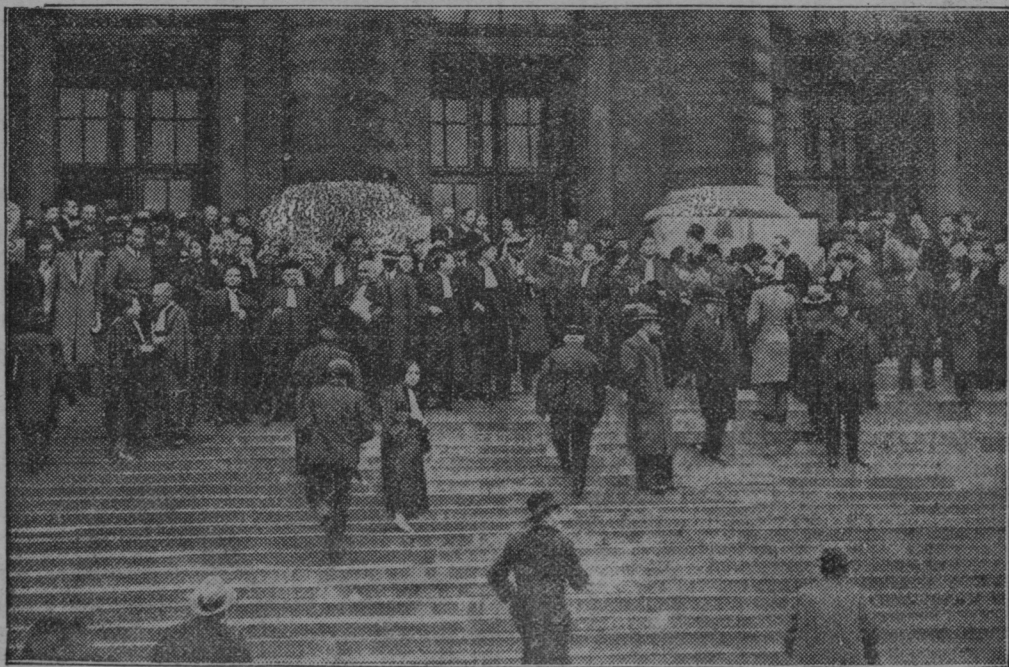
Pariški advokati demonstrirajo zaradi znane afere Staviski pred palačo pravosodnega ministrstva.

slopij uničena tudi krma, gospodarsko orodje itd.; znaša okoli 140.000 Din in je le deloma krita z zavarovalnino.