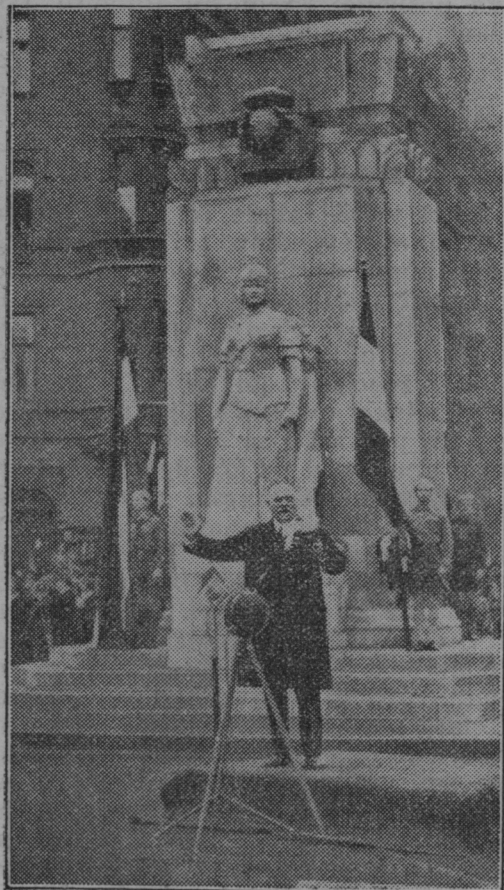
Spomenik 542 žrtvam v Budimpešti, ki so padle v boju proti komunistom pod strahovlado Bela Khuna.

okolici, in Polana, ki spada pod novo nastalo občino Hotiza. Zlasti obširna je po tej uredbi novo ustanovljena občina Lendava okolica. Srez Dolnja Lendava bo po tej uredbi obstajal iz naslednjih občin: Beltinci, Bogojina, Črensovci, Dobrovnik, Hotiza, Lendava, Lendava okolica, Odranci, Orešje in Turnišče, ki je dobilo še Radmožance in Brezovico.