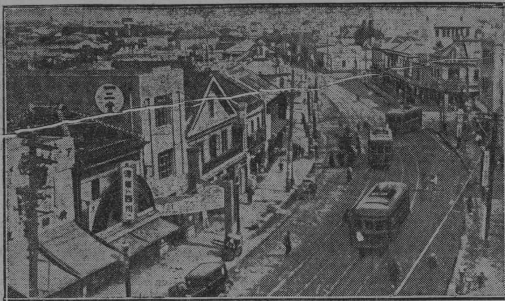
Grozna požarna nesreča v japonskem mestu Hakodate, ki je zahtevala nad 1000 smrtnih žrtev.