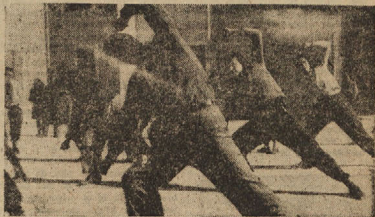
ISTRSKI MLADINCI ŽE VADJO ZA 1. MAJ

Letošnje vaje za prvomajski nastop so zelo lepe, toda zahtevajo mnogo vaj. Posebno ženske vaje in one za odrasle pionirje so zelo lepe, in jim je treba posvečati več pažnje, ker so tudi težje. Po vseh vaseh in ustanovah naj takoj začnejo z vajami, če niso še začeli. Ne smemo čakati zadnje dni. Do 1. maja imamo še komaj dva meseca. Če hočemo, da bo prvomajski nastop zares uspel, ne smemo več izgubljati nobene ure. V zadnjih dneh, ko bo vse polno dela in priprav, ne bomo mogli nadomestiti, kar bomo sedaj zanemarili.