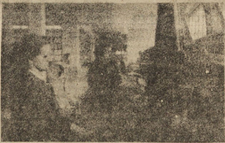
DVE UDARNICI PRI DELU V TOVARNI USNJA NA VRHNIKI

Kar se tiče plačanega letnega dopusta, zahtevajo delavci, da se podajša v skladu z leti dva božična