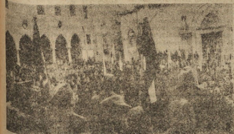
PROSLAVA RDECE ARMADE V KOPRU