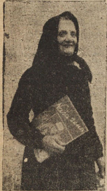
STARA ISTRSKA ŽENA RADA CITA SVOJ LIST

Tudi pri nas se žena danes zaveda važnosti svojega sodelovanja v borbi proti anglo-ameriški imperializmu in njegovim nakanam, da bi popolnoma zasušili tukajšnje ljudstvo in ga oropal njegovih najosnovnejših pravic: to je pravice do dela in kruha, pravice do svobodnega političnega izživeljanja in pravice do kulturnega razvoja. Danes se naša žena zaveda, da hočejo anglo-ameriški imperialistični iskoriščevalci s tem, da dopuščajo delodajalcem svobodno odpuščanje delovnih sil, ustava-