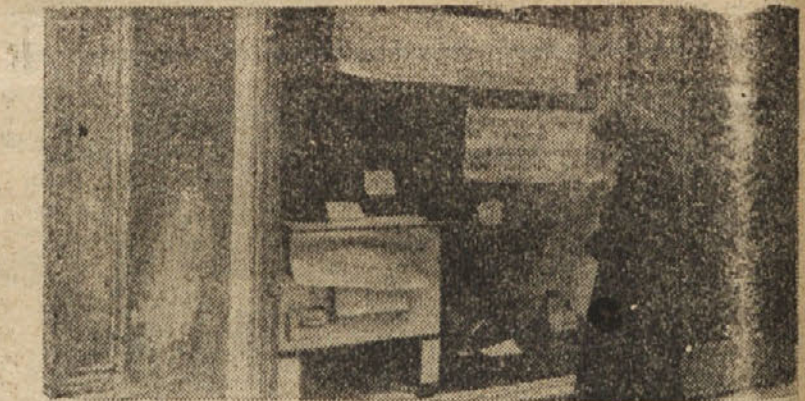
BODOCA NEVESTA OPAZUJE RAZS TAVLJENE DOBITKE LOTERIJE ASIZZ V KOPRU

Ob priliki kongresa antifašističnih žena Tržaškega ozemlja je ASIZZ istrskega okrožja organizirala loterijo, ki je vzbudila med istrskimi ženami veliko zanimanje. Zrebanje se bo vršilo 8. marca, prvi dobitke je lep štedilnik, drugi vsa potrebna kuhinjska posoda, tretji lepa ženka potna torbica. Predmeti so razstavljani v Kopru, Izoli, Piranu, Bujah, Umagu in Novem gradu.