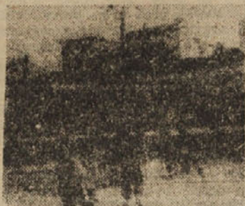
OTROCI ZBIJAJO ZOGO

lavke prav radi čitajo na domu ali pa v čitalnici, ki je res udobna in privlačna. Dramatski odsek je tudi razvit; imajo dva pevstva zborov, moškega in ženskega.