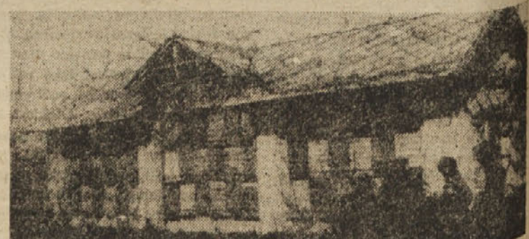
IVAN SABADIN V VANGANELU IMA LEP CEBELNJAK

Umen čebelar skrbi, da ima vedno le dobre, mlade matice. (Se nadaljuje) Dr. B.