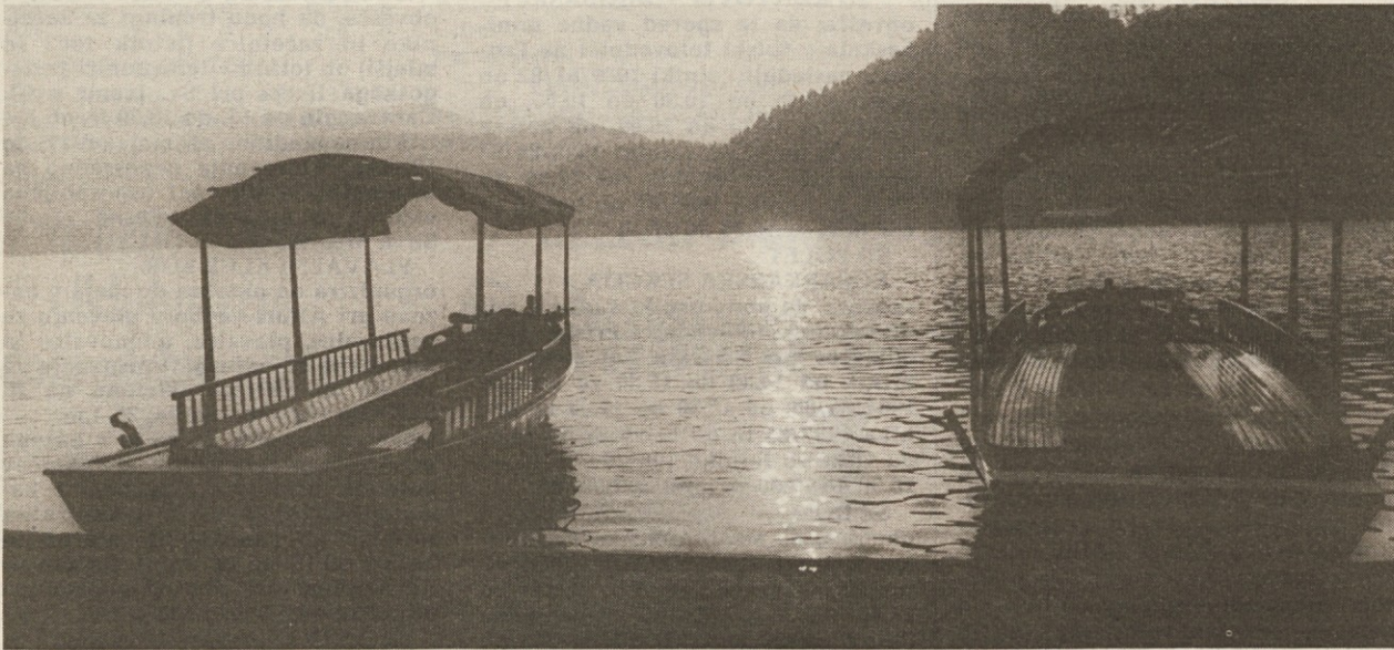
Blejske pletne počivajo v sončnem zatonu: jesen na Blejskem jezeru je edinstveno doživetje