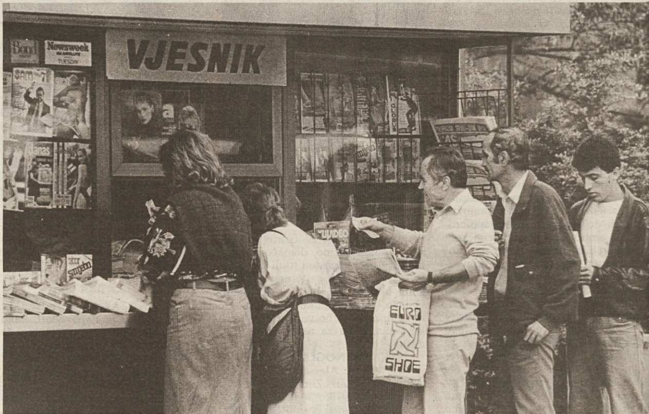
Za hrvaške neodvisne novinarje so pod Tudjmanovo oblastjo nastopili hudi časi