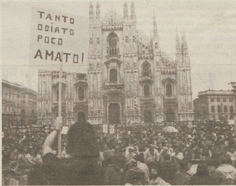
Delavci so s transparenti v Milanu izpričali svoje ogorčenje