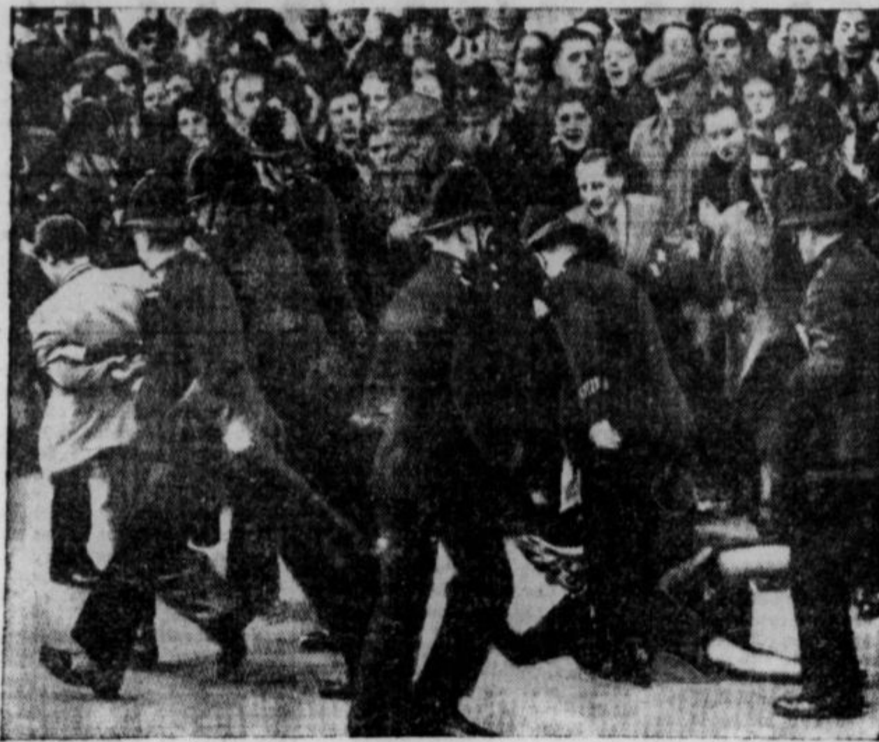
Sir Oswald Mosley je bil svoječasno poslanec angleške delavske stranke v parlamentu. Oglasil se je za mlintanega socialista. Ker ni mogel nikamor, se je prečeval v fašista in postal "firer" fašističnega gibanja v Angliji. Pred par tedni so se na nekem fašističnem shodu fašisti in "rdečkarji" stekli, in po zraku je švigalo kamenje. Eden je priletel Mosleyju v glavo in ga udaril težko, da so ozavstnega odpeljali v bolnišnico. Policija ima v takih spopadih veliko opravila, a zlasti temu Mosleyjevo gibanje ni nevarno demokraciji v Angliji. Nevarna pa ji je torijska vlada, ki je tudi glavna

pakroviteljica nadaljevanja klanja v Španiji. Ona neče lojalistične zmage, ker se ji zde lojalisti "poreadikalni", zato ji je general Franco ljubi, ker bo chrand in pretektral kapitalistični sistem, ako zmaga. Torej so torej pravi fašisti, čeprav govore o demokraciji, dočim so Mosleyjevci le razboriteži. Delavska stranka se bo morala oprijeti v boju proti torijem jasje taktike, ako neče, da zavzori torijska vlada vse demokracije v Evropi. — Na liki je prizor s spopada med fašisti in "le-vicariji" v Londonu.