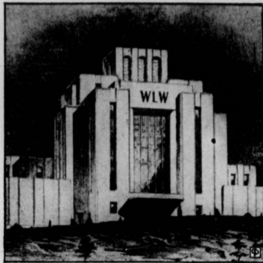
Na sliki na vrhu je nova moderna radio oddajna postaja WLW in WSAI v Cincinnatiju, Ohio. Stane okrog $1.000.000.

Prosvetna matica je edina slovenska kulturna centrala v Zedinjenih državah. Storila je na prosvetnem polju brez vsakega vika in krika več kot katerakoli druga skupina.