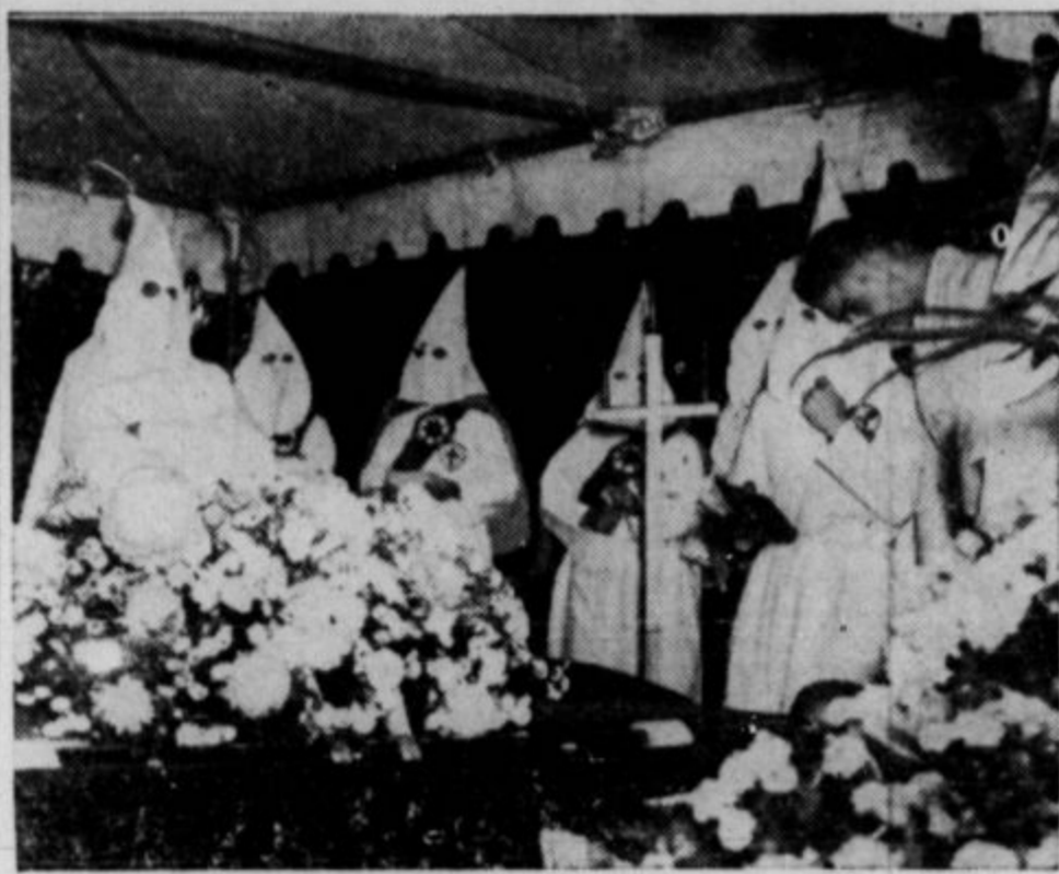
Napadi na novega člana vrhovnega sodišča Hugo L. Blacka zaradi njegovega včlanjenja v KKK, ki se vztrajno nadaljuje, nudijo baš nasprotni učinek. KKK prospera in raketirja, ki mu načeljujejo, žanjejo. Sploh boj proti Blacku ni nič drugega kot bojproti socialnim reformam, ki jih propaga new deal. KKK je reakcionarjem le pretveza v tej borbi, da skrijejo svoj pravi namen. Kluki pa so se njihove reklame pridno poslužili in spet paradirajo po ulicah, zaigajo ob večerih križe, uganjajo ceremonije na pokopališčih, pobijajo "neoljalnost" in "komunizem" še posebej. Za človeške pravice se kluki ne brigajo, pač pa samo za "amerikanizem".