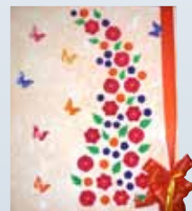
Darilo POŠ Utik

Nas pa je posebej presenetilo domiselno darilo POŠ: slika, ki so jo izdelali učenci in učitelji. Na njej vsak sklop rožic ponazarja število učencev v vsakem od treh razredov in metuljčkov, ki predstavljajo pedagoške delavce in kuharico na naši POŠ v Utiku.