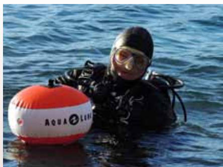
»Gremo se potapljat!«

V maju je stanje v morju glede samega življenja zelo dinamično. Za veliko organizmov je to čas razmnoževanja in voda je polna življenjskih sokov, ki plavajo v vodi ter čakajo na oploditev. Raztopljeni