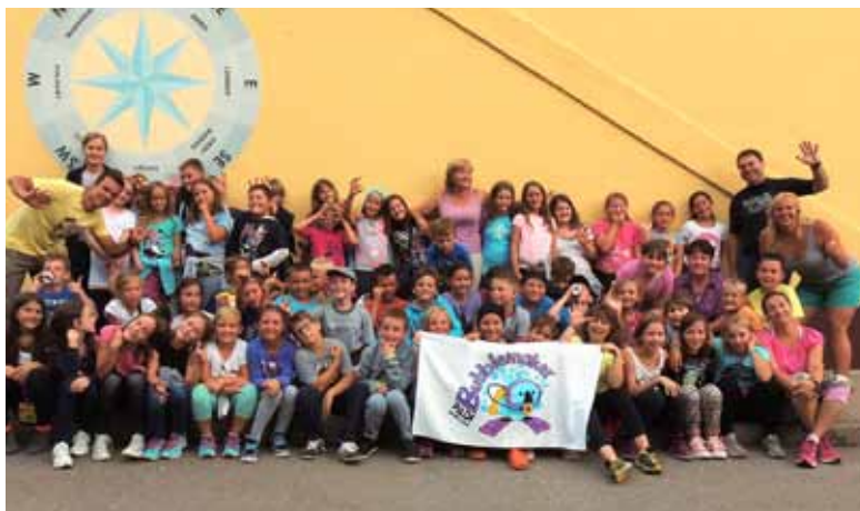
Šola v naravi Pineta 2014: zadovoljni učenci in učitelji po uspešno izvedenih spoznavnih potopih v morju.

Večina tečajnikov me poišče po priporočilu, kar me veseli. Tako že v osnovi dobim tečajnika, ki ga priporoča oseba, ki se že potaplja. Tak človek je za delo primerno motiviran, kaže večje zanimanje in zavzetost. Znanje tako hitro vpija in tudi osnovnih veščin potapljanja se zelo hitro nauči. Potem opravimo skupaj še nekaj dodatnih potopov ter ob tem utrdimo naučeno. Kasneje se občasno ponovno srečamo na kakšni potapljaški lokaciji in ponosen sem, da se znajo potapljati in s potapljanjem tudi nadaljujejo.