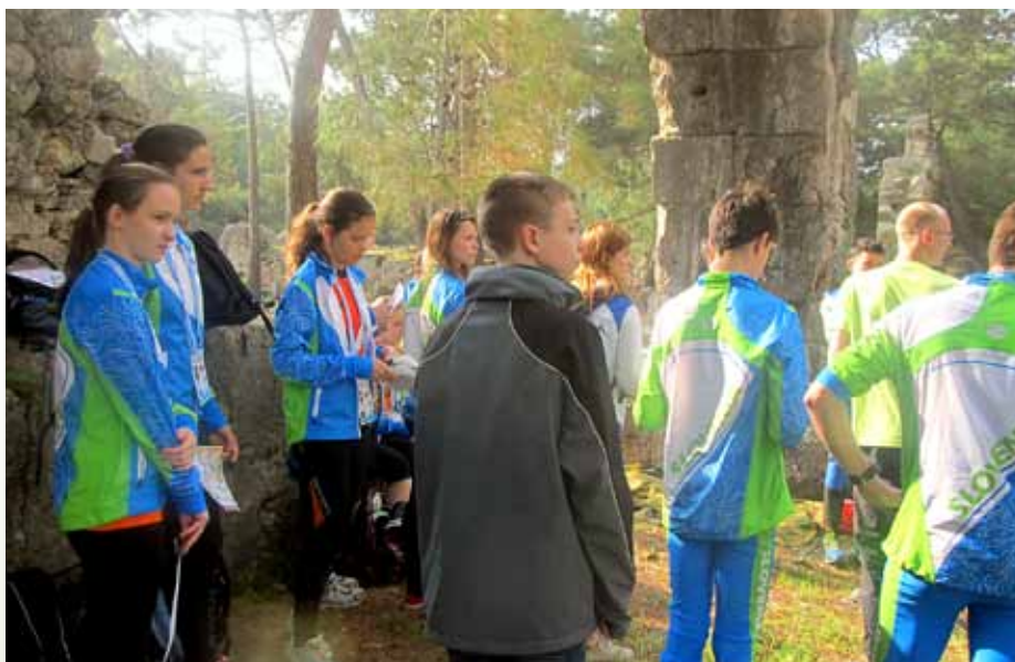
Uradni trening smo imeli med razvalinami rimskega mesta Phaselis