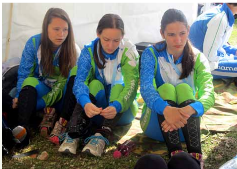
Koncentracija pred startom

Povabilo za udeležbo na svetovnem prvenstvu smo dobili, ko so naša dekleta postala ekipne šolske državne prvakinja. Vendar je bilo pred nami še precej dela. Treba je bilo zbrati finančna sredstva, trdo trenirati in se udeleževati tekmovanj, urejati dokumente, zbirati predstavitveni material in še bi lahko našteval.