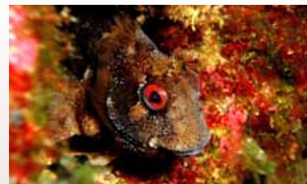
Velika babica radovedno pogleduje iz razpoke v steni, v kateri se počuti varno!

Moja šola potapljanja je namenjena praktično vsem tistim, ki želijo spoznati podvodni svet nekoliko bližje. Osnovna teoretična znanja podajam iz priročnikov svetovne priznane organizacije potapljanja PADI, saj sem tudi sam šolan po PADI standardih. Inštruktor sem že peto leto in v tem času sem licenciral oziroma registriral nekaj manj kot 200 tečajnikov.