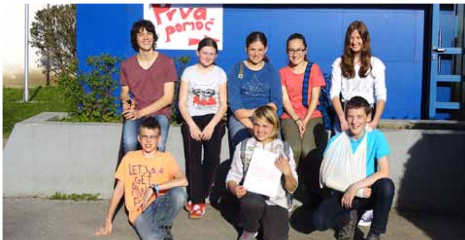
Ekipa na regijskem preverjanju

poškodovanca z raztrganino na desnem licu in zaprtim zlomom desne ključnice in osebo s poslabšanjem sladkorne bolezni. Na drugem poligonu je bila oseba z zvinom levega kolena in izbitim zobom, drugi poškodovanec pa je bil otrok brez znakov življenja. Na tretjem poligonu je oseba doživela epileptični napad, pri čemer je utrpela rano na zatilju, drugi poškodovanec pa je imel popolno amputacijo kazalca desne roke in udarnino na čelu.