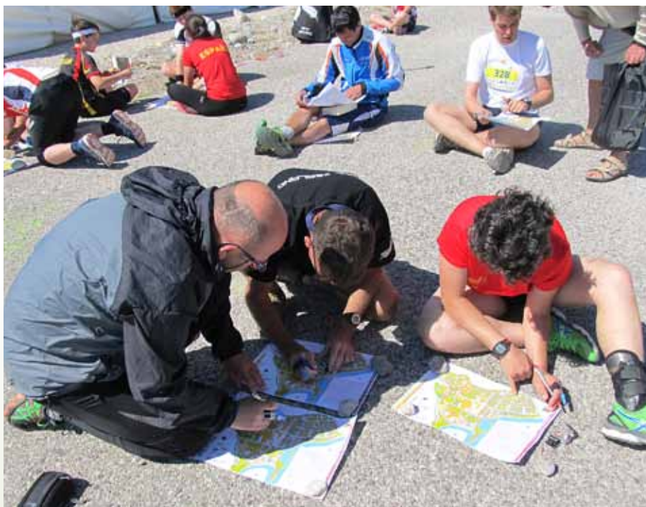
Mednarodna ekipa študira karto pred startom

V soboto, 18. aprila, je prišel dan odhoda in na letališču Jožeta Pučnika se je zbrala celotna slovenska reprezentanca. Prvi let smo zaključili v osem milijonskem Istanbulu, ki pa skupaj z okolico šteje kar trinajst milijonov prebivalcev. Nato pa je bil pred nami še krajši let do Antalye. Tam so nas gostitelji že pričakali pod velikanskim panojem. Od letališča smo z avtobusom nadaljevali pot skozi Kemer in še dalje do manjšega obmorskega letovišča Tekirova. Do hotela Queen's park Tekirova smo prišli ob enajstih zvečer.