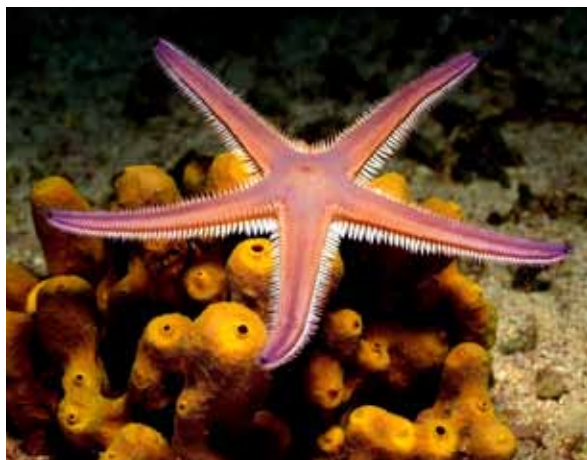
Vitka morska zvezda na žveplenjači – lepe kontrastne barve in linije