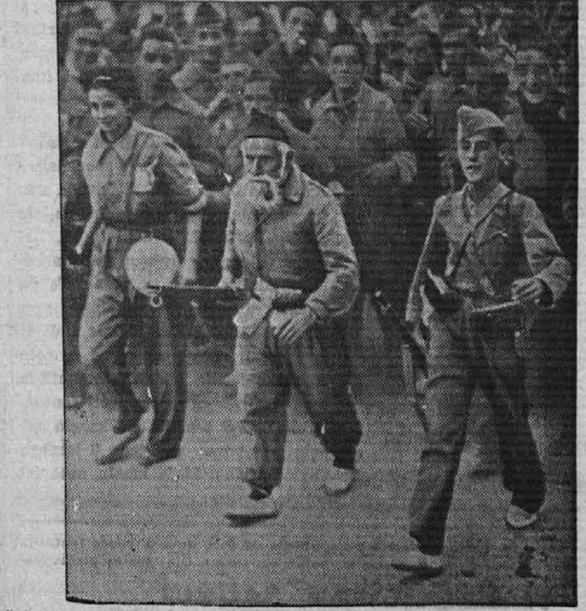
Španska državljanska vojna: Oče, hči in sin korakajo v vrstah ljudske milice na fronto

Vladna križarka "Cervantes" je v ponedeljek, ko se je nahajala pred pristaniščem v Cartageni, dobila v svoj bok torpedo, ki jo je resno poškodoval. Vlada v Valenciji trdi, da je napad izvršil nemški podmornik ter se je zato tudi pritožila v Ženevi, Londonu in Parizu. Nemci to