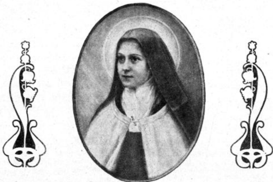
Sv. Terezija Deteta Jezusa

Pod naslovom »Nebeške rože« izhaja nova zbirka izbranih, posebnega priporočila vrednih knjig, ki obravnavajo razne zadeve duhovnega življenja in služijo bogoljubnim namenom. Vsaka knjiga ima jako krasno opremo in je primerna kot darilo ob različnih prilikah.