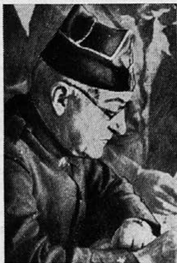
General Miaja, poveljnik vladnih čet

Kolektivna (skupna) varnost obstoja v tem, da sklepajo države take pogodbe, ki ne izključujejo nikogar in katere jamčijo vsem, ki pogodbo sklenejo, skupno pomoč za slučaj napada od katere druge države. Za male države je to posebno važno, ker jim dajejo te pogodbe možnost učinkovite obrambe, kajti le njihova lastna armada proti napadu kakšne velesile ne bi zadostovala. Tistim državam pa, ki pripravljajo v