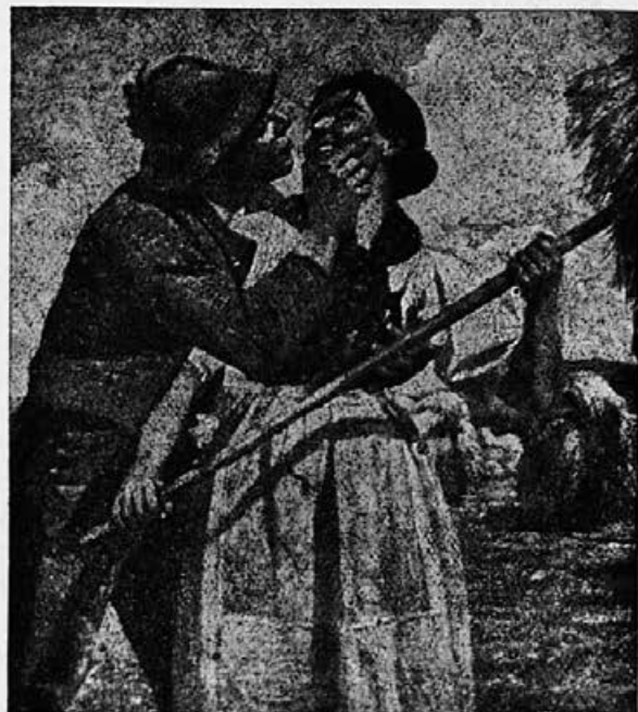
Delo, mladost in ljubezen