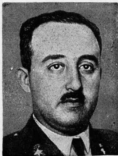
General Franco, voditelj španskih upornikov

se vojna sreča kaj lahko prevrne. Jugo- slavija je v španski vojni nevtralna — ne pomaga niti vladi, niti upornikom. Tudi nabiranje prostovoljcev je že od vsega početka prepovedano.