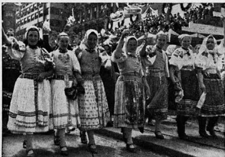
Kot morje valovijo ogromne množice brhkkih deklet v narodnih nošah — članic naše sorodne češkoslovaške organizacije v ogromni povorki po praških ulicah

Nad 80.000 kmetskih fantov in deklet, vsi v pestrih narodnih nošah, obdani z zastavami in zastavicami, prapori, venci, slavoloki, je pojoč in vzklikajoč korakalo po praških ulicah. Ure in ure se je vila vrsta, vedno večje navdušenje, pesem, godba in zopet nove vrste mladine, vesele, ponosne, enotne. Tako silne, mogočne manifestacije Praga menda še ni doživela, kot jo je pokazala v tistih dneh združena kmetska mladina iz Češke, Slovaške, Moravske, Šlezije in Podkarpatske Rusije. Bila je to veličastna slika zdravja, moči, sloge in kmetske zavesti češkoslovaške kmetske mladine.