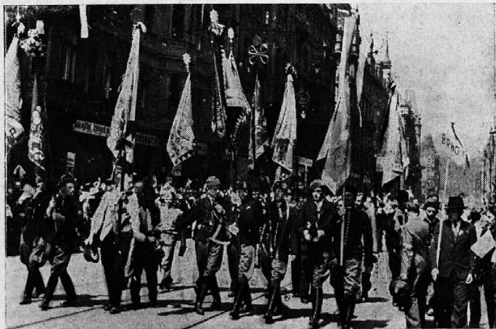
Iz veličastne proslave v Pragi. — Skupina krepkih zastavonoš z našimi zelenimi prapori

Naj bi bila njihova organizacija za vzgled tudi našemu kmetijsko-mladinskemu gibanju, posameznikom — našim pripadnikom in pripadnicam pa bodri lo še za nadaljnje vztrajno delovanje, da si priborimo, kar želimo!