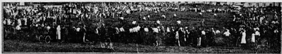
Tisoči in tisoči dajejo priznanje in čast kmetškemu delu! — Vse se pridružuje kmetško-mladinskemu gibanju

Kmetška mladina je s tem praznikom dokazala, da razume svoje geslo, s katerim je tov. Kronovšek končal svoj govor: »V delu in slogi vstajamo!«