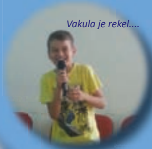
Vakula je rekel....