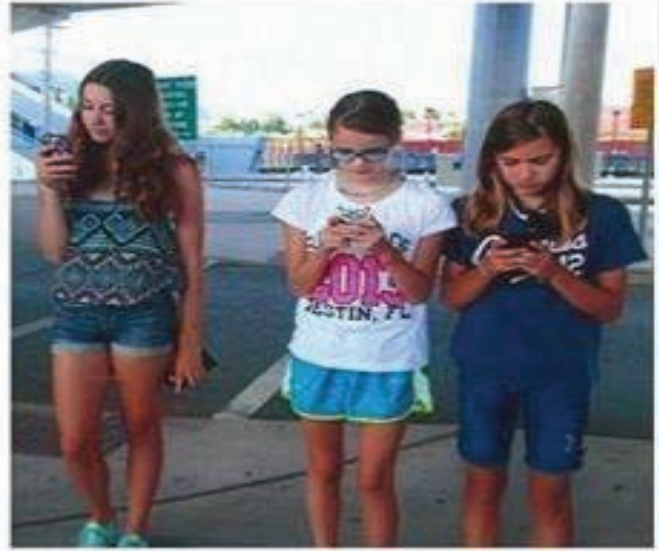
In ne to!