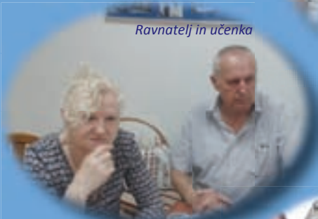
Ravnatelj in učenka