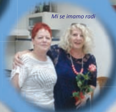
Mi se imamo radi