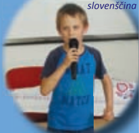
Angleščina je zanj prava šala, slovenščina tudi....