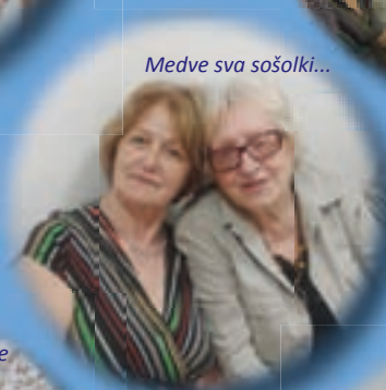
Medve sva sošolki...