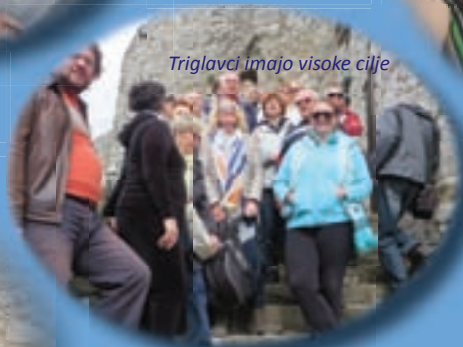
Triglavi imajo visoke cilje