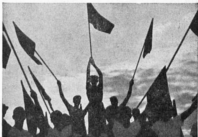
Mladi na stadionski tribuni.

Sonce kožo pordeči. To pomeni, da so se kožne in podkožne krvne žilice razširile, da je prišlo na površje več krvi, s čimer se pospešuje splošni krvni obtok, kar ima ugodne posledice: poglobljeno dihanje, poživiljeno delovanje drobovja, pospešeno pre-