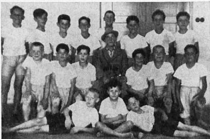
Mladci FO Loka pri Zid. mostu.

Sedež ima društvo v Karitativni pisarni v Ljubljani, Marijanišče. Tam se sprejemajo vsi dopisi in dajejo vsa pojasnila.