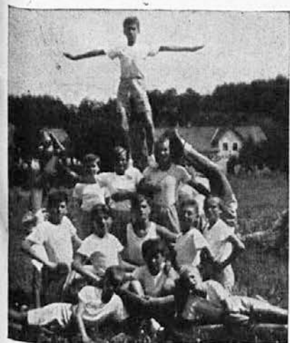
Mladci FO Ježica.

Pozajtrkovali so. Gospodar mu je ukazal, naj dopoldne gnoja napelje na njivo. Popoldne pa, je dejal, bodo listje grabili. Matevž je ubogal. Nakidal je, zapregel konje in odpeljal. Na vse strani je raznašal pomladni veter dušečo soparo, ki se je vlekla iz mastnega gnoja. Matevž je ljubil tako življenje. Gnoj voziti, ga na debelo raztrositi, da pokrije razzebno prst, držati plug, vdihavati vlago, ki jo izpuhtevajo na novo obrnjene brazde, in si z rokavom otirati znojno čelo. To ne zna vsak. To tudi ne diši vsakemu. Sonce ga je žgalo po obrazu, zlasti po