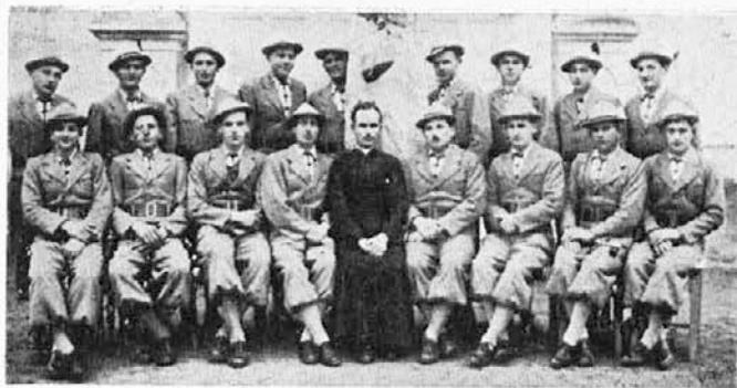
Fantovski odsek Ljutomer.

V take misli zatopljen je koračil za vozom in skopaval gnoj na kupe. Pravkar je izpraznil voz, hotel obrniti konje, ko je zaslišal lahen klic. Anica mu je pomahala z roko, ko je zalivala v gredi solato. Hip nato je že odhitela v vežo. Matevžu so zažarele oči in obraz in se mu je raznežil. Počil je z