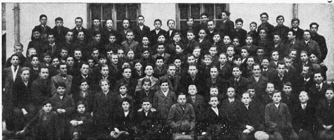
Letošnji mladčevski tečaj v Celju.