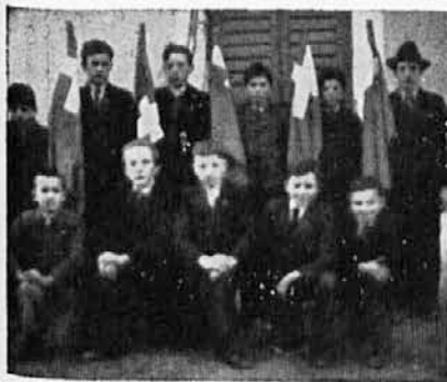
Mladi FO št. Vid pri Stični.