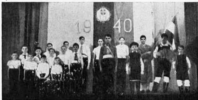
Mladi FO Ljubljana - mesto.