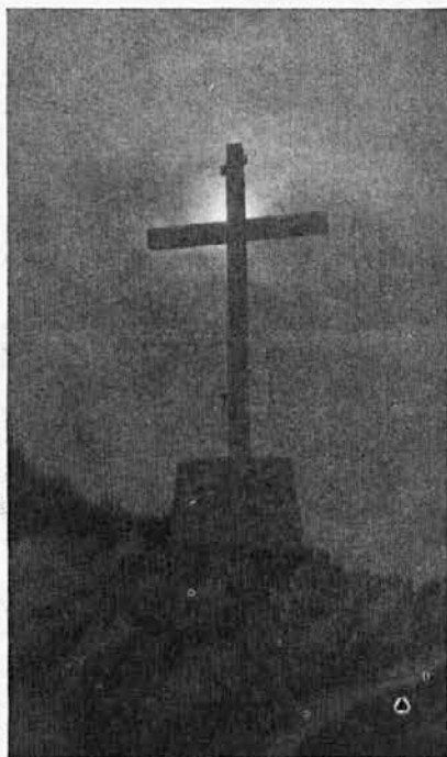
Križ naš up edini.

Svetli so torej naši ideali, fantje, na pot k idealom, pa čeprav je strma!