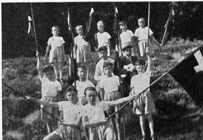
Mladi FO Límbuš.

Sonce kožo tudi potemni. Tako dobimo zagorelo polt, ki je v današnjem svetu, zlasti športnem, hudo v čislju. Pri mnogih novodobnikih je zarjavela polt celo edini cilj sončenja, zdravstveni nameni so jim postranskega pomena. Da bi čimbolj počrneli, uporabljajo razne maže, ki pospešujejo potemnenje kože. — So pa tudi taki ljudje, ki se pretirano boje za svojo nežno belo polt, da je ne bi skazile sončne pege. Zato se mažejo z zaščitnimi mazili, ki zadržujejo