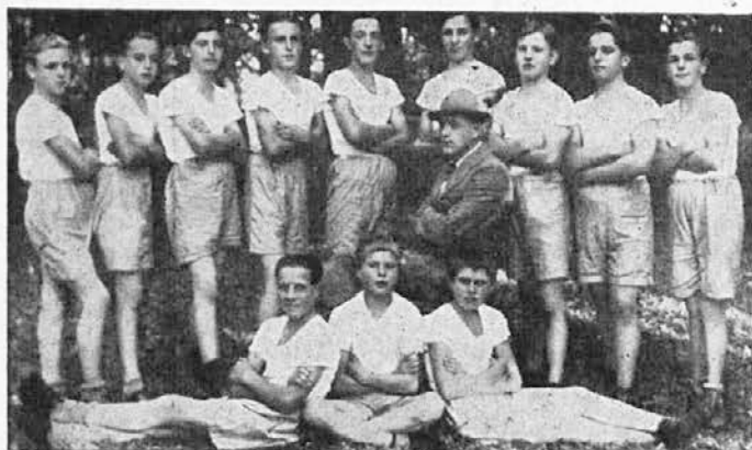
Mladci FO Gornji Logatec.