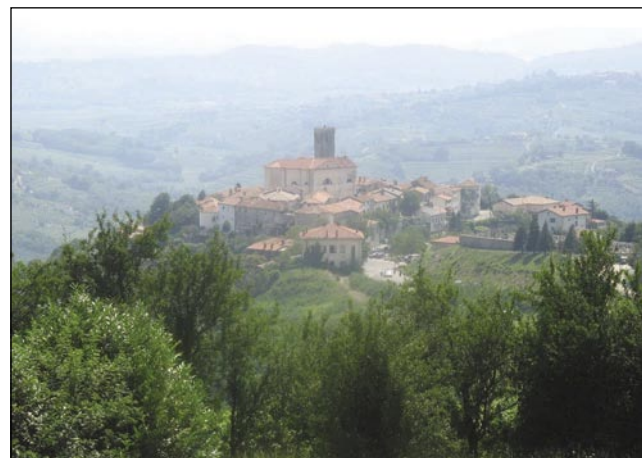
Martinova vas Šmartno v Goriški Brdaj

Od avtoceste do Nove Gorice pela hitra cesta (autōút), po šteroj šoferge brž pridejo do duplanskoga varaša, eden tau šteroga je v Italiji, drūgi pa v Sloveniji. Po Gorici je svojo ime dobila mala krajina Goriška Brda. Gda se pelamo prauti njé, vidimo na viskom bregej Marijino prauškarsko