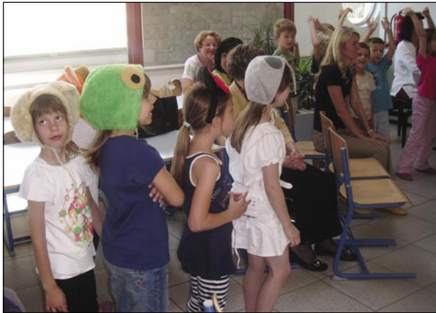
Na OŠ Lucija so nas prvošolčki presenetili z zanimivim programom

Petek je bil namenjen celodnevemu izletu, in sicer udeležili smo se kulturnozgodovinske ekskurzije v Trstu. Po ogledu znamenitosti mesta smo obiskali slovenski vrtec in šolo na Opčinah pri Trstu, popoldne pa smo si ogledali