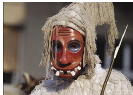
Eden član laufarske družine

so vertinje sküjale za vekše svetke. Tau so globonclinge, šteri so napunjeni s krumplinami pa cverki. Kauli nji je testau, štero spomina na stari francuski klubük. Poznani je takzvani »smukavc« tó, šteri je gausta župa s kapüsto pa krumplami.