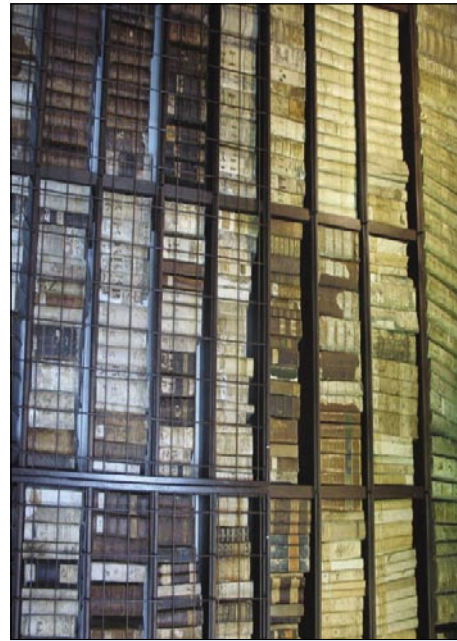
Stare knjige na policaj klauštra v Vipavskom Križi

V nedelo zrankoma so prauškarge iz Sombotela meli eške telko cajta, ka si pred mešov