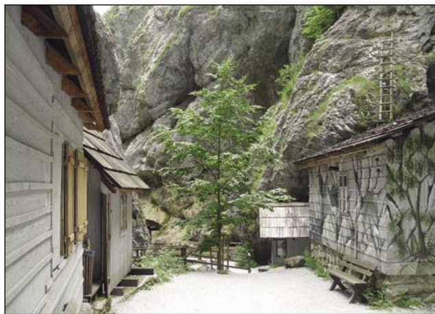
Nemci so nikdar nej najšli partizanske špitale

šlau, po svejti so začnili nücati bole zdrave materiale. V gnešnjom cajti pa že kaže, ka do rudnik dokončno zaprli. Najgir lidgé leko tau petstau lejt staro pripovejst spoznajo v muzeji »Antonijev rov«, gde se vsikši leko spisti par stau mejterov pod zemlaup.