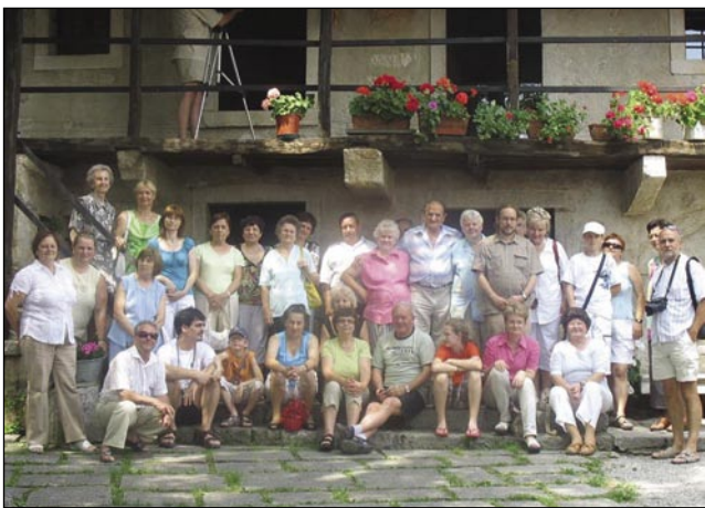
Člani sombotelskoga društva pred Kraškov izov v Repni