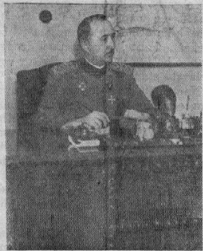
General Simović, katerega glavni stan je v Egiptu

"Ko so do teh čet prišle prve vesti o premirju, so borci zapustili svoje polke, noseč s seboj orožje in municijo. Njihovi poveljniki niso prav nič storili, da bi to preprečili, mar-