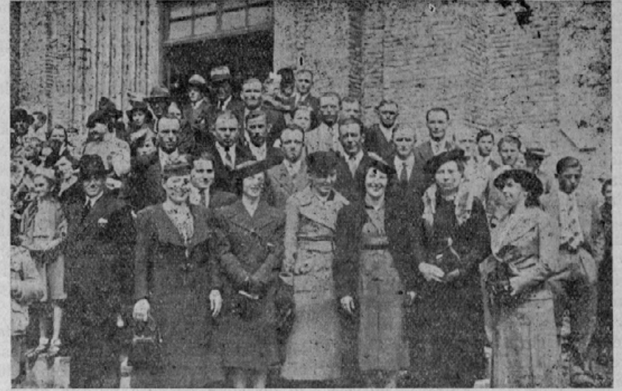
Botri in botre z zadnje birme v Rosariju