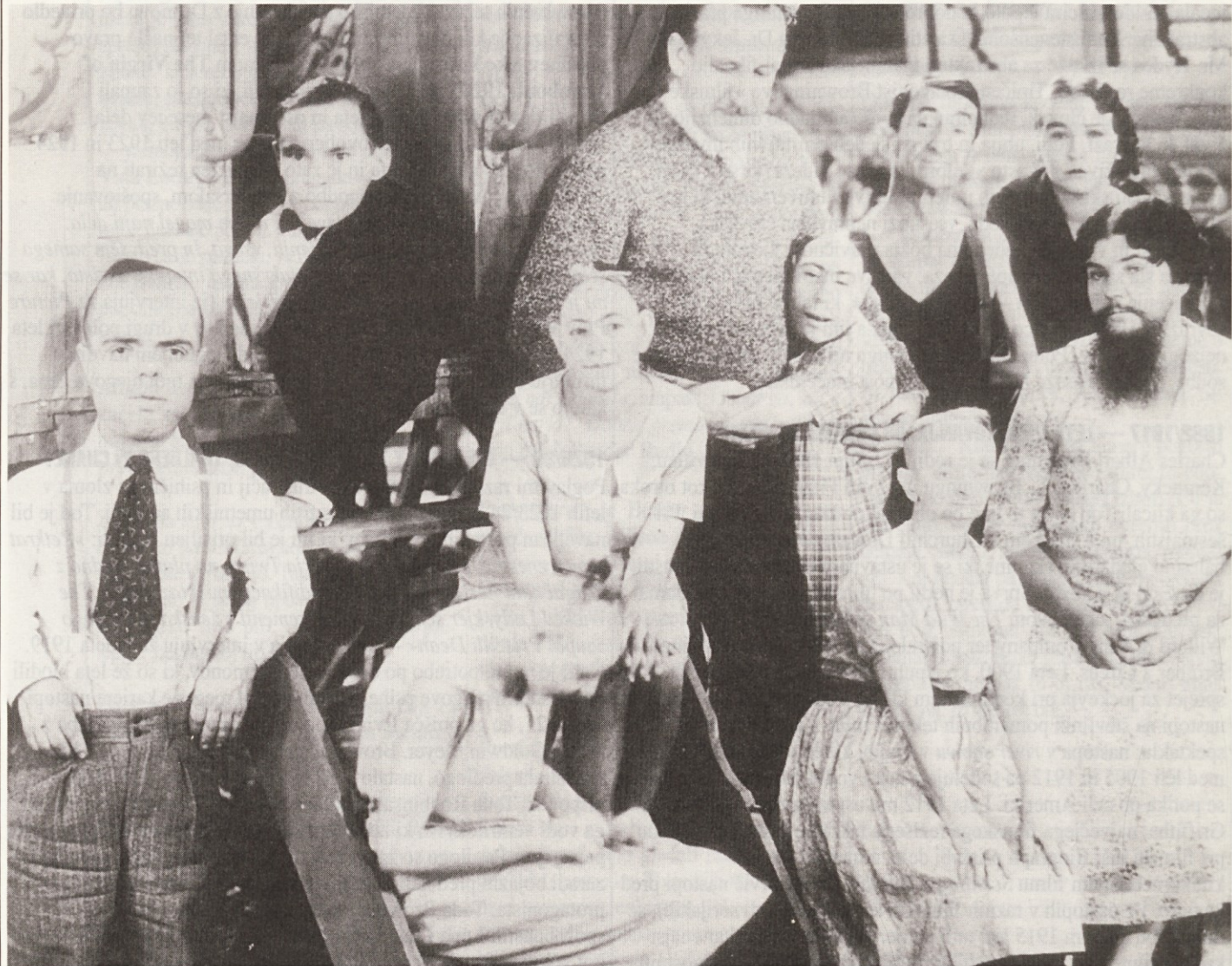
Tod Browning med snemanjem filma Freaks

Po dolgih pogajanjih z dediči Brama Stockerja je Universalu avgusta