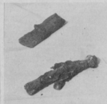
Bronasta sekira in bronasta konica salice iz bojevnikovega groba