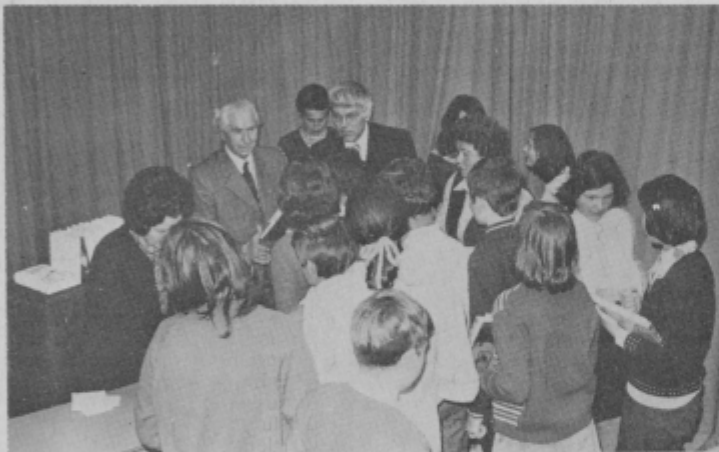
Iz letošnjega srečanja pisateljev in učencev OŠ Poljčane.

pri iskanju knjig in širšemu razumevanju vsebine, jih vspodbujajo in z njimi tudi doživljajo končni uspeh. Zaključna svečanost je tako težko pričakovani trenutek vseh tekmovalcev in njihovih voditeljev, sošolcev in staršev. Še posebno doživetje pa pomeni za vse tekmovalce srečanje učencev z nekaterimi avtorji knjig.