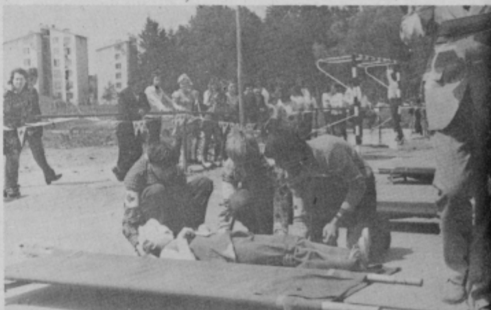
Množičnost in spretnost sta značilnosti letošnjega tekmovalca mladih članov RK občine Slov. Bistrica