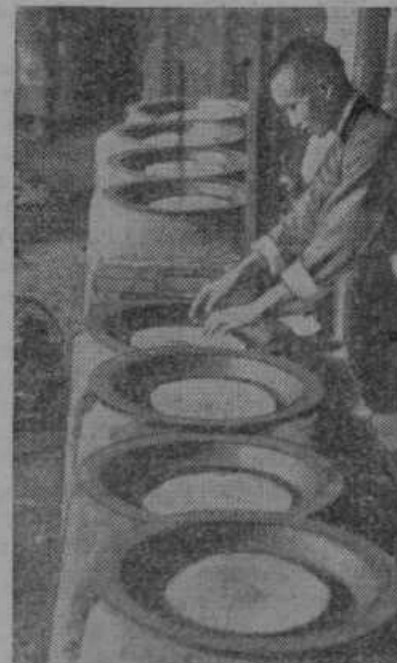
Kruh za kitajske vojake. Kitajski vojak na fronti dobi vsak dan hleb kruha, katerega imenujejo »kwangpau«.