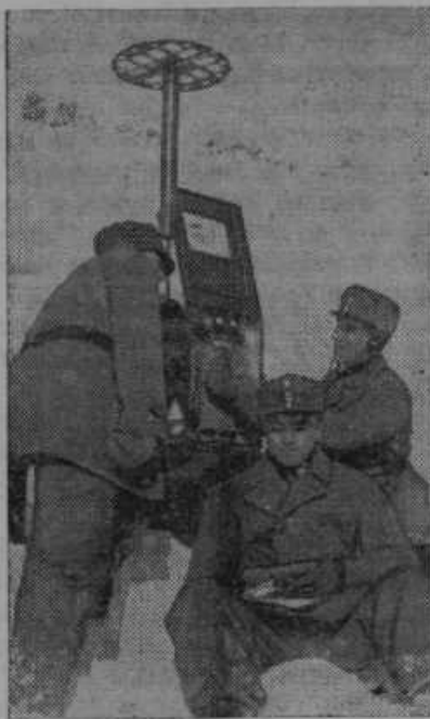
Rešilna odprema v Alpah ima radijsko oddajno postajo. Take ekspedicije rešujejo od snežnih plav-zov zasute smučarje.