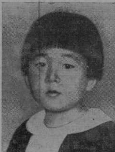
Tsugu, štiriletni japonski prestolonaslednik.

Ljutomer. Krajevna Kmečka zveza v Ljutomeru priredi s sodelovanjem Sadjarske in vrtarske podružnice in drugih strokovnih organizacij 14 dnevni poučni tečaj o vinarstvu, sadjarstvu in kletarstvu. Tečaj se prične 30. januarja in bo trajal do 5. februarja. V nedeljo bo ob devetih otvoritev tečaja s poučnima predavanjima o vinarstvu in sadjarstvu. Ob delavnikih bo vsak dan od 8 do 12 poučno predavanje, od 13 do 17 pa praktične vaje o rezi, cepljenju in vseh drugih opravilih pri vinarstvu in sadjarstvu. Po-