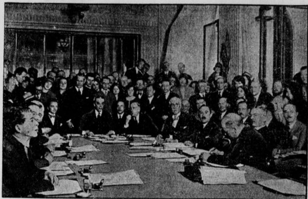
Podpis pariškega sporazuma v reparacijskem vprašanju.