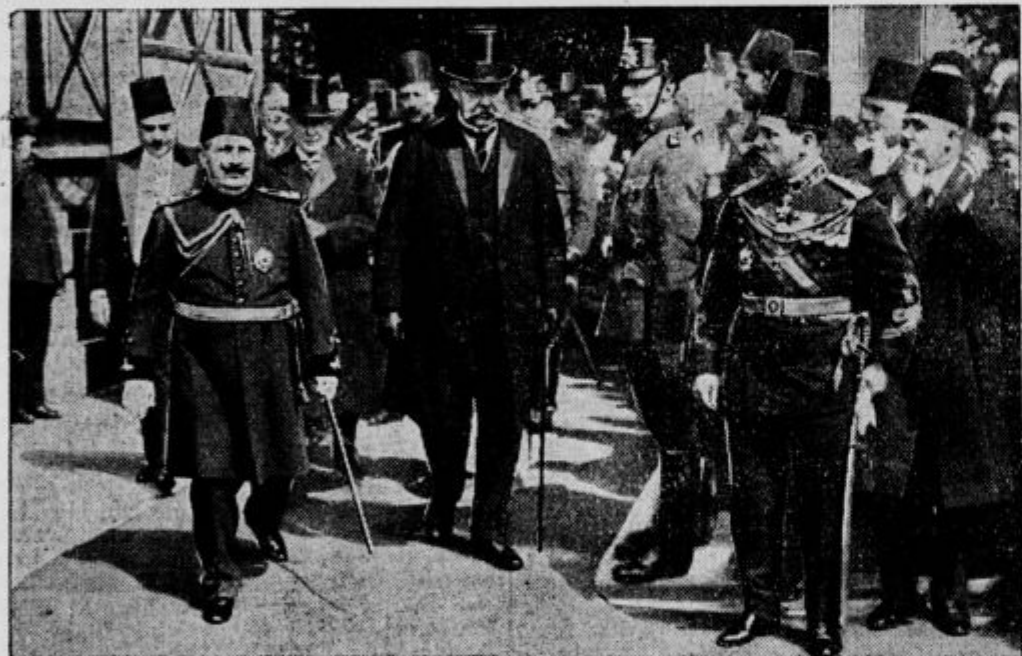
Egiptovski kralj Fuad v Berlinu. Slovesen sprejem kralja na kolodvoru. Desno od kralja gre drž. predsednik Hindenburg.

Desno krilo vlade je sestavljeno po večini iz mož, ki so iz liberalne stranke. Tu je častitljivi lord P. A. M. P. M., predsednik tajnega sveta in glava delavske stranke v zgornji zbornici. S svojimi 77 leti zre mladostno na življenje, pravi predstavitelj angleškega učenjaka in svetovnega grajana. — Minister za zrakoplovstvo lord Thomson je mlad mož, sijajen vojni zgodovinar, ki je opravljal v vojni važne službe. — Enako so prišli iz liberalnega tabora minister za Indijo Wedgevoood Benn, poljedelski minister Buxton in prosvetni minister sir Charles Trevelyan. Trevelyan je mož posebne znanke — potomec velikega zgodovinarja Macaulaya, literat in sijajen član londonske visoke družbe. Je izredno bogat in zbira na svojih gradovih najizbranejšo družbo.