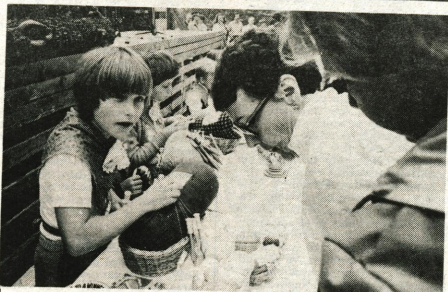
Veliko izseljencev se je zbralo na letošnjem izseljenskem pikniku v Škofji Loki, kar priča, da so njihove vezi z domovino še vedno trdne in da se radi vračajo domov. Škofjeločani vsako leto poskrbijo, da jim predstavijo del tradicij in dediščine preteklih stoletij. Letos je za to poskrbela čipkarska skupina iz Žirov, ki je na prireditvi prikazala izdelovanje čipk. — V. Primožič