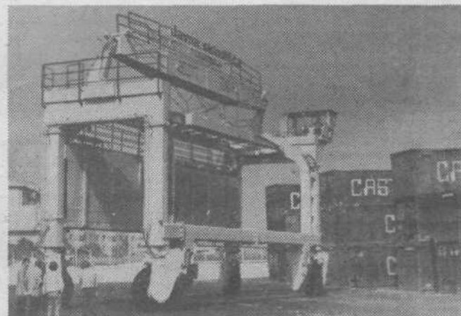
Sodobno hitro pretovarjanje zahteva tudi takele gigante

Aktivno delovanje družbenopolitičnih organizacij in samoupravnih organov ter razvoj samoupravljanja je za sluga tudi dobrega informiranja. Od obstoja dalje smo dali viden poudarek obveščeniosti naših delavcev. Že od januarja 1. 1963 izdajamo glasilo delovne organizacije in od februarja 1970 dnevne tiskane informacije, ki jih letno izide ok. 100. Oba pisana medija prideta v roke vsem delavcem, v njih pa be-