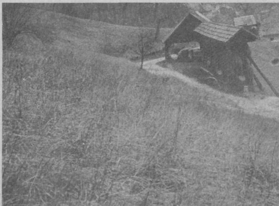
Ljubo Božjak. Vinjska kozolča 2

Že med potjo nazaj sem videl, da čisto gladko ne bo šlo. Tudi kakšen naročen izzivač bi se lahko utihotapil. Sklicali smo vse reditelje, ki so nosili na desni roki rdeče pasove, in jih pozvali, naj skrbijo za red in disciplino, hkrati pa naj vsakdo svojemu oddelku dopove, kaj terja načelnik kot