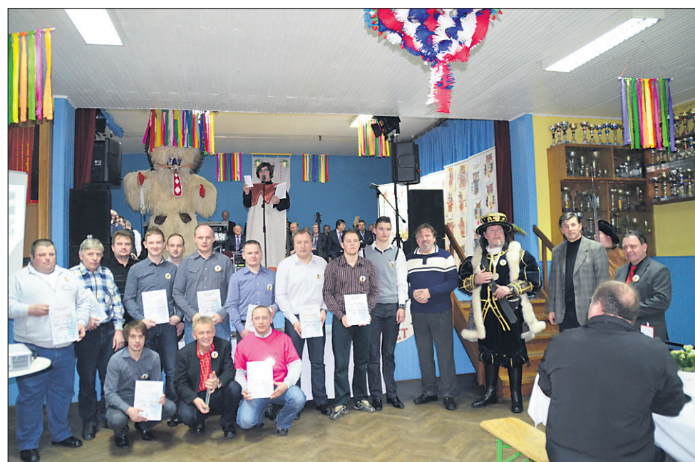
Društvo Korant Podvinci je obeležilo 10 let obstoja.