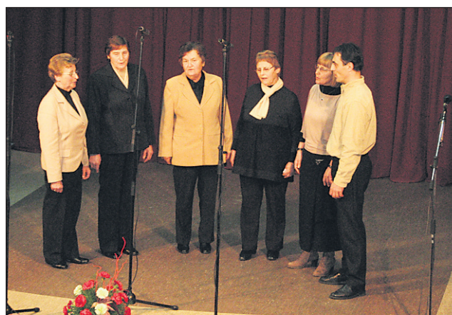
Nastopilo je deset skupin iz vseh treh občin na širšem ormoškem območju.