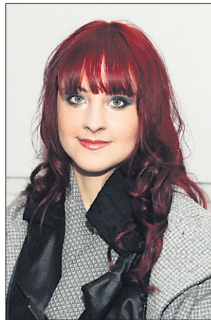
... in pozneje

no krilo, kjer se mešajo vzorci in barve v odtenkih svetlo modre, sive in črne. H krilu sem izbrala še sivo bluzo, črno športno jakno in siv plašč. Ker je zunaj mrzlo in je Doroteja najraje v hlačah, sem se odločila, da namesto nogavic tokrat pod krilo oblečem ozke kavbojke svetlo modre barve. Črni škornji športnega sloga in črn klobuček sta še tisti dve malenkosti, ki zaključu-