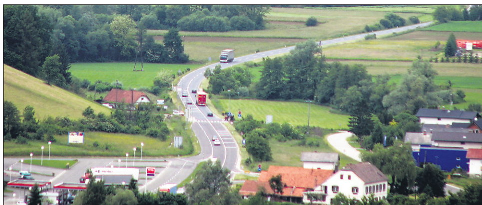
Bodoča avtocesta od Dražencev do Gruškovja, ki je trenutno ocenjena na 175 milijonov evrov, naj bi se (zelo verjetno) gradila v treh fazah – v tretji fazi naj bi se tako gradila za občane zelo pomembna vzporedna cesta.

Za izdelavo projektne dokumentacije je v letošnjem letu predvidenih 2,7 milijona evrov. Sklep o dodelitvi dveh milijonov evrov iz proračuna EU prav namensko za ta odsek je Evropska komisija sprejela lani oktobra. „Ob izdelavi PZI je za letos predvidena še izdelava presoje s stališča prometne varnosti ter izdelava investicijske dokumentacije,“ so še povedali