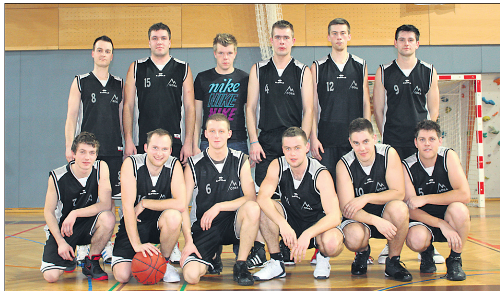
Ekipa ŠD Ptujška Gora trenutno zaseda 3. mesto v 2. ligi.