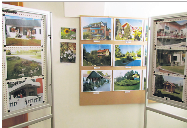
Turistično društvo je s fotoaparatom zabeležilo številne lepe primere skrbi občanov za urejeno okolje.