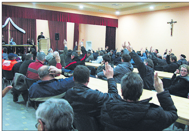
Zbrani občani so z dvigom rok na srečanju v vaško-gasilskem domu v Gajevcih soglasno podprli ustanovitev društva za boj proti gradnji daljnovoda Cirkovce-Pince.

občini Videm je tudi Vesenjaj na sestanku v vaško-gasilskem domu v Gajevcih zbranim položil na dušo, naj se ne pogovarjajo s predstavniki Eles