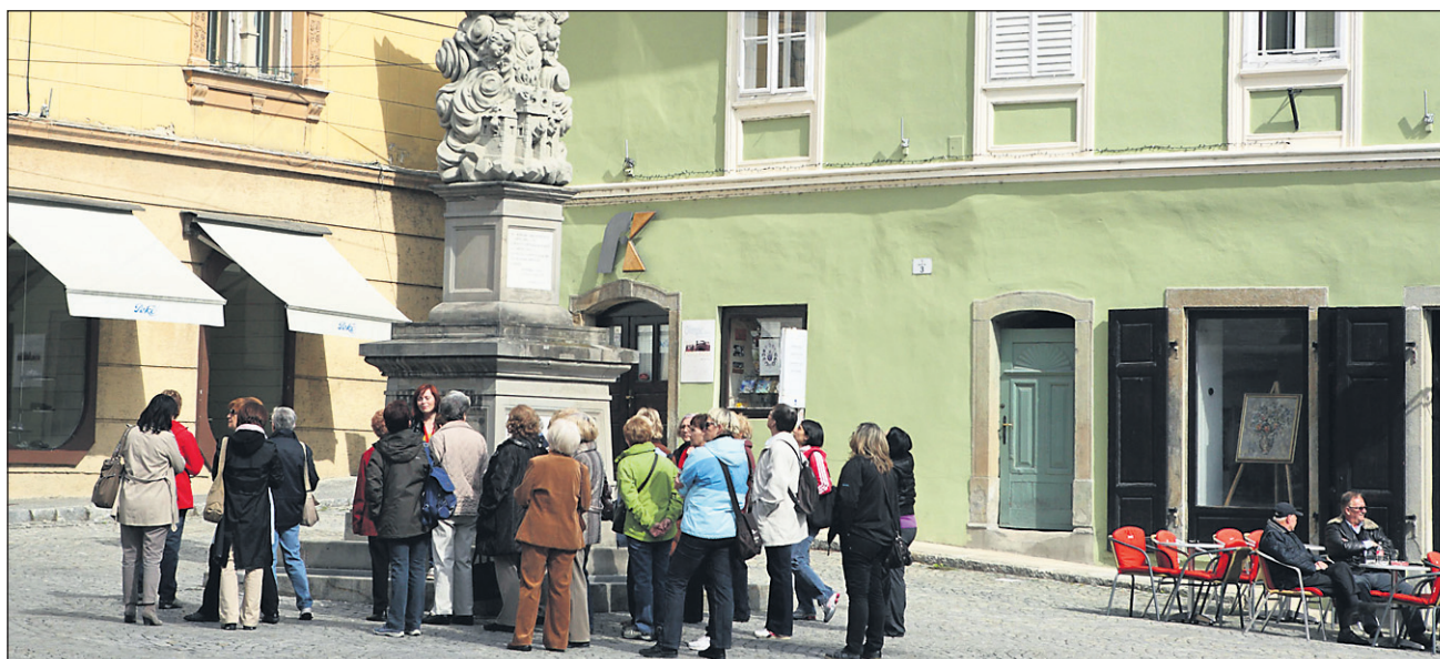
Bo mestno jedro še dodatno izgubilo na ponudbi?

Ne glede na vse pomisleke pri obeh odlokih je pomembno predvsem dejstvo, da se je mestna oblast začela zavedati, da so potrebni konkretni koraki oziroma ukrepi za oživitve mestnega jedra.