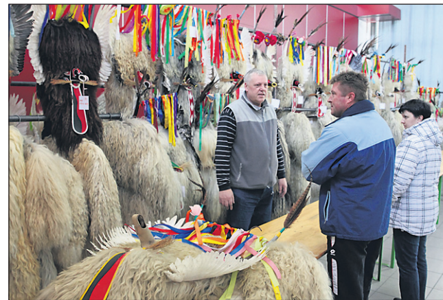
V večnamenski dvorani v Spuhli je 26. in 27. januarja potekal že 21. tradicionalni sejem rabljene korantove opreme.