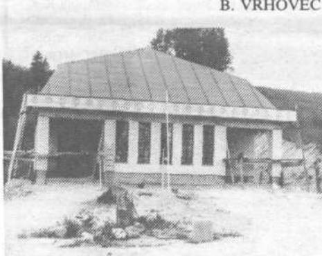
Nova mrliška vežica

podjetje Ljubljana, levji delež pa so znova prispevali domačini sami, ki so zbrali kar 80 odstotkov potrebnih sredstev in namestili bankine. B. VRHOVEC