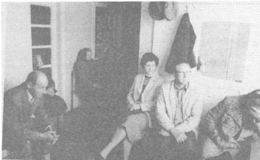
Zavit hodnik, ki predstavlja čakalnico zdravstvene postaje v Velikih Laščah je vedno nabito poln

kelj trdi, da ljudje tukaj niso v enakopravnem položaju z Ljubljančani. V Ljubljani imajo namreč ljudje stalna dežurstva, večjo možnost specialističnih pregledov. Težave imajo tudi ob zdravljenju na domu povsem negibnih pacientov. Zdravnica jih obiskuje po rednem delovnem času. Žal jim ne more nuditi rednega tedenskega obiska. Medtem, ko je ona na terenu, se namreč lahko zgodi marsikaj. Pacient, pa čeprav je nujen primer, bo moral čakati nekaj ur, saj ni takrat v ambulanti nikogar, ki bi mu pomagal.