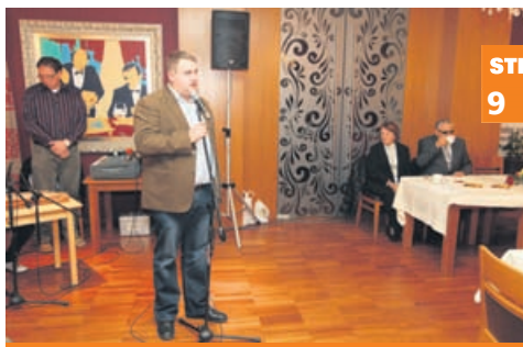
V Celju srečanje slepih literatov