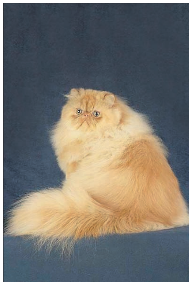
Moulin Rouge: »Tako, zdaj sem pripravljen za razstavo!«