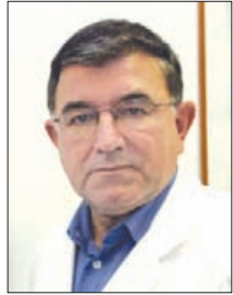
Piše: prim. JANEZ TASIČ, dr. med., spec. kardiolog

Dodatki v hrani, pomožna zdravilna sredstva, čaji ... lajšajo številne težave, poleg tega različni zdravilci obljublajo ozdravitev brez sodelovanja zdravnika. Med omenjenimi