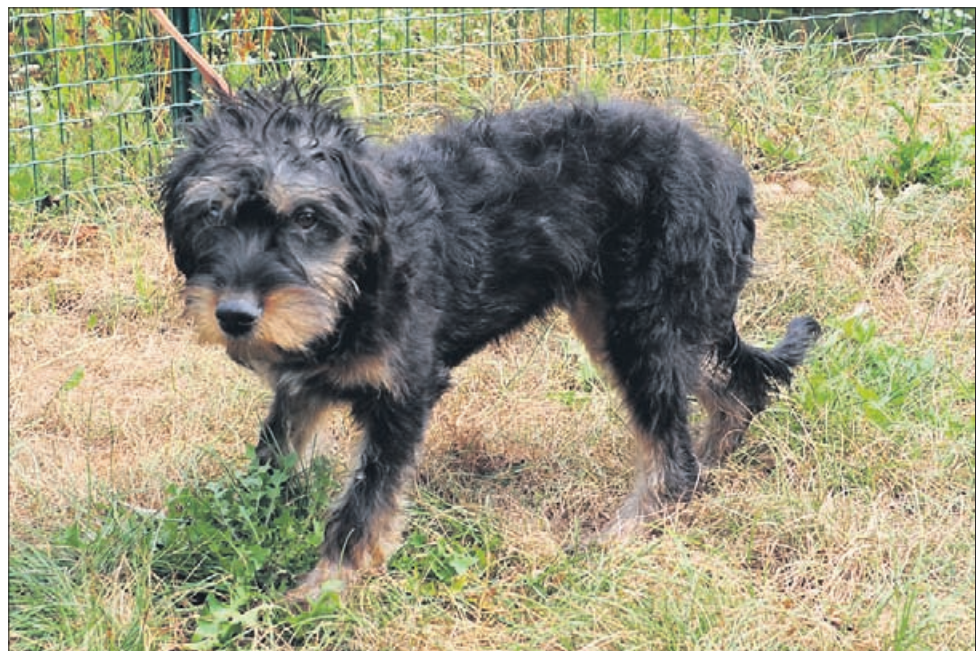
Tara je mešanka manjše rasti, stara 8 mesecev, sterilizirana.