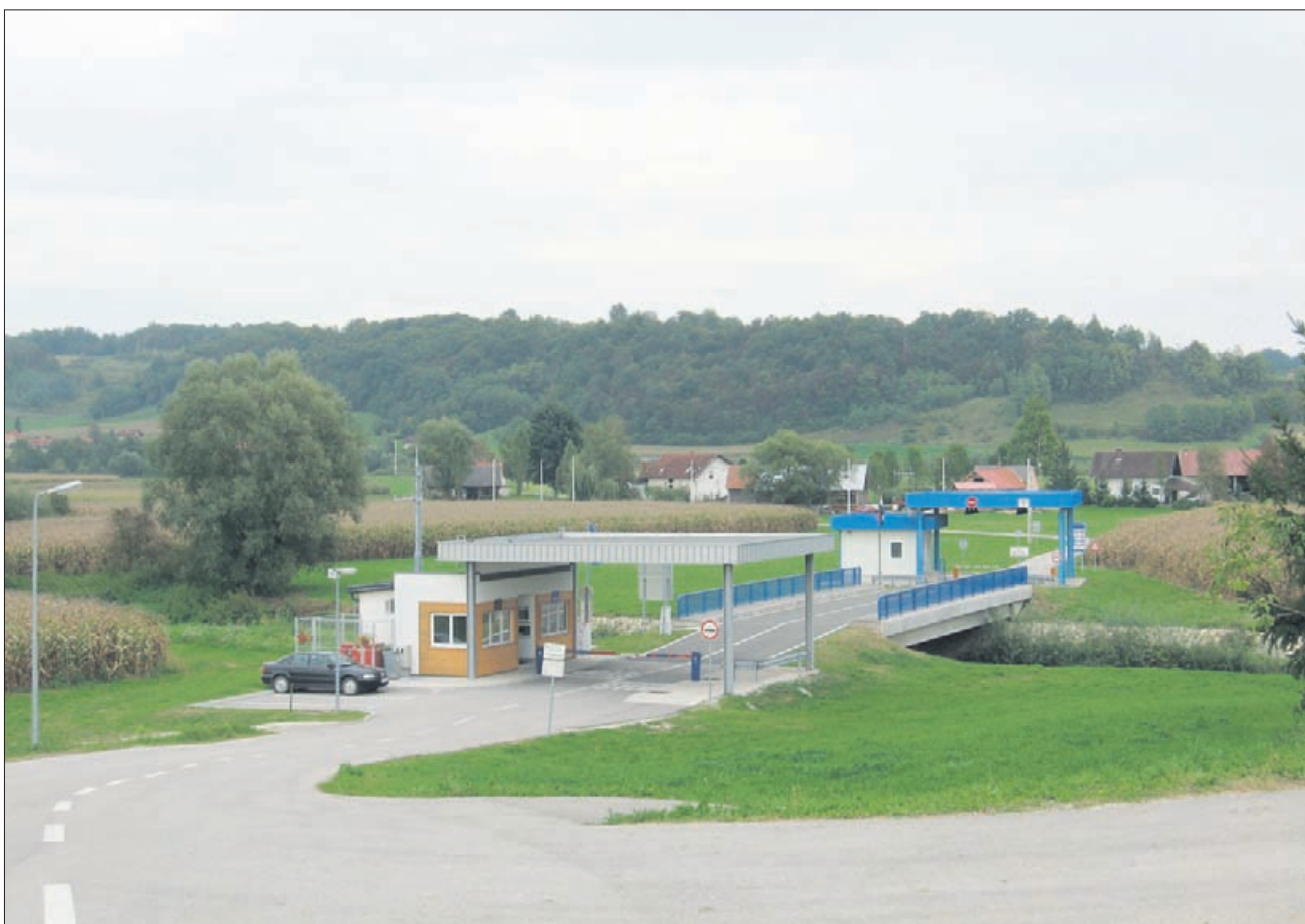
Kako dolgo še, čez mejo na Sotli, po ovinkih čez oddaljeno Sedlarjevo? Na fotografiji mejni prehod v Sedlarjevem, ki že dobra tri leta nadomešča zaprti mejni prehod v Imenem pri Podčetrtku.