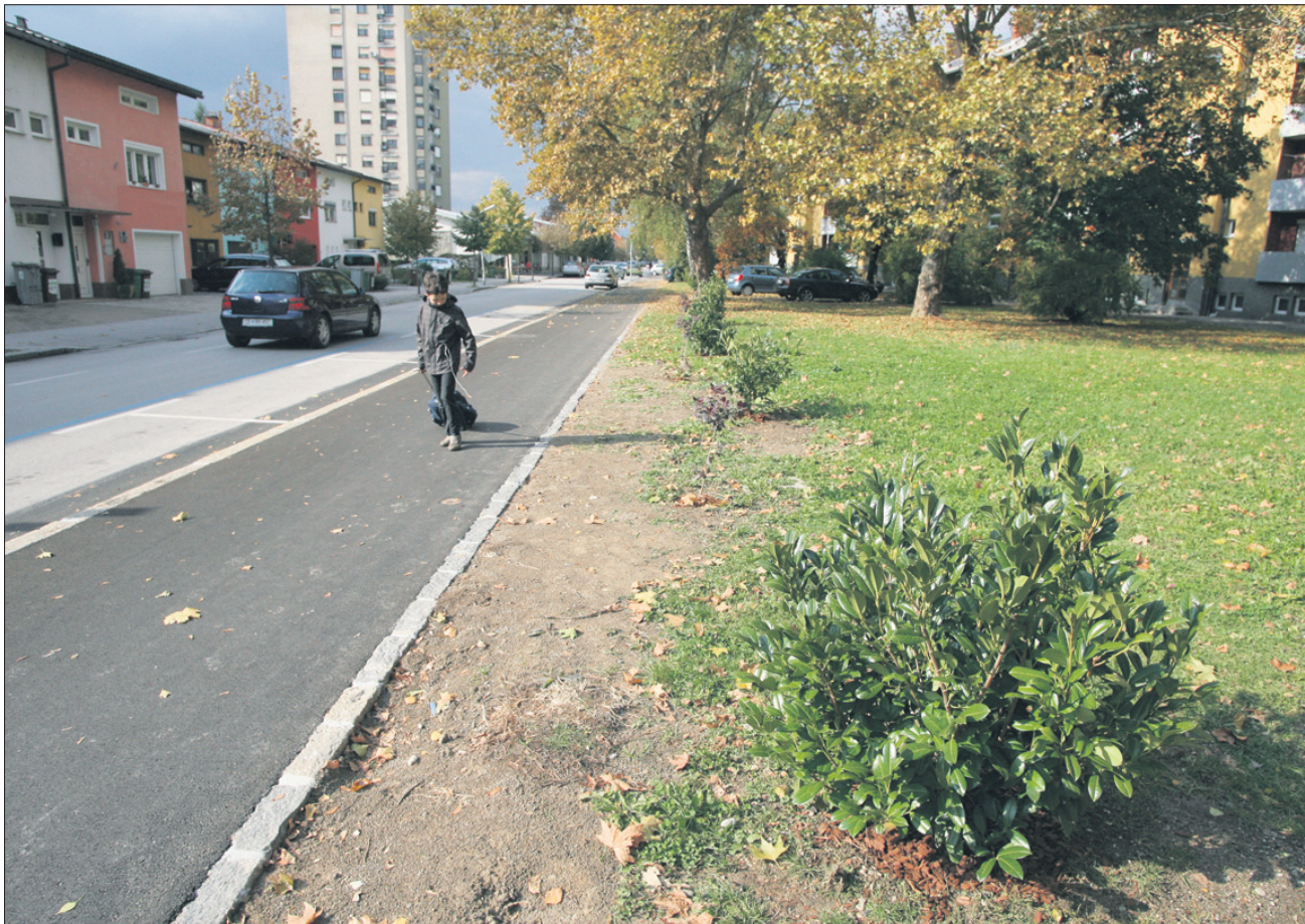
Z zasaditvijo okrasnih in cvetočih grmovnic dobiva novo podobo Trubarjeva ulica.