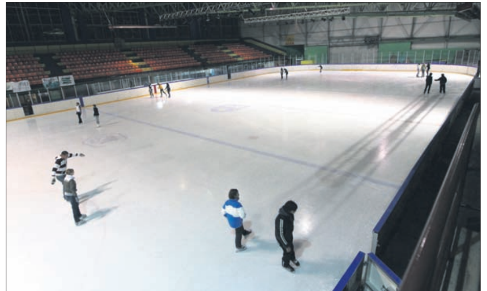
V petek zvečer so rekreativci za začetek sezone drsali brezplačno.

Poleti v hladu Ledene dvorane pripravijo kakšno prireditev za otroke in mladino, v času od oktobra do marca pa je v njej priložnost za tečaje drsanja. Letno jih opravi tudi do 700 učencev prvih in drugih razredov vseh celj-