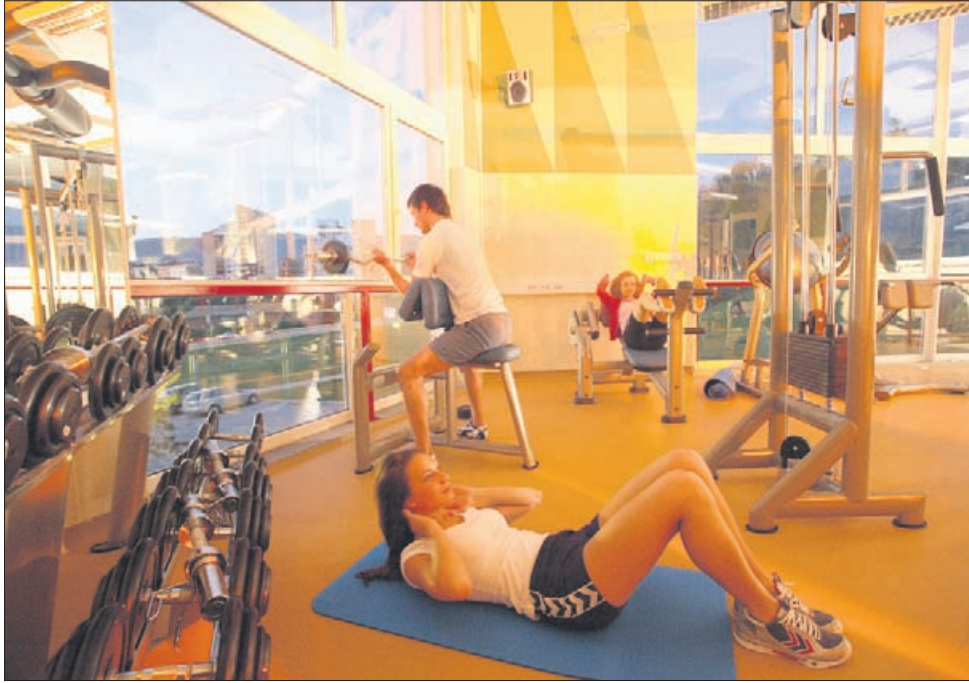
V velenjskem bazenu prisegajo še na dodatno ponudbo. Poleg rekreativnega in tekmovalnega plavanja predvsem na vadbo v fitnessu in savnanje.