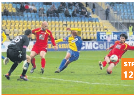
Razburljiv obračun sosedov s popolnim preobratom