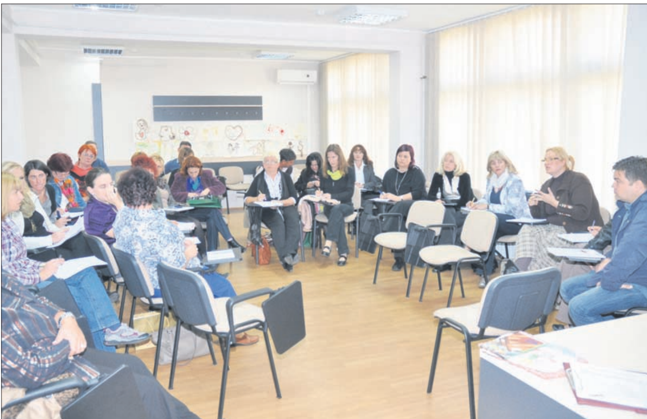
Z druge projektne delavnice med obiskom v Srbiji, kjer so bili predstavljeni primeri dobrih praks s področja družbenih dejavnosti.

ŽALEC – Razvojna agencija Savinja je že pretekli leti sodelovala v projektu Zdržimo zanje in izkušnje za trajnostni razvoj, s katerim so bili postavljeni temelji dvostranskega sodelovanja med državama Slovenijo in Srbijo. Za letos in prihodnje leto so te stike nadgradili v projekt Trajnostni razvoj nas povezuje, k sodelovanju pa na slovenski strani pritegnili vso Savinjsko regijo.