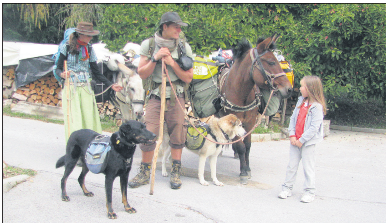
Popotnika s svojo živaljo družino ob prihodu v Galicijo

Ljudje se odpravljamo spoznavat svet na različne načine. Tisti, ki želijo biti čim prej na nekem kraju, v drugi državi ali na drugem kontinentu, si izberejo letalo, spet drugi se podajo na pot z ladjo, ki je bila glavno prevozno sredstvo tudi daleč nazaj v zgodovini, tretji prisegajo na vlak, ki ima svoje korenine že v časih iznajdbe parnega stroja. Veliko jih potuje s svojimi avtomobili ali z avtobusi. So pa tudi taki, ki se odločijo spoznavat svet bodisi z motorjem, s kolesom ali celo peš.