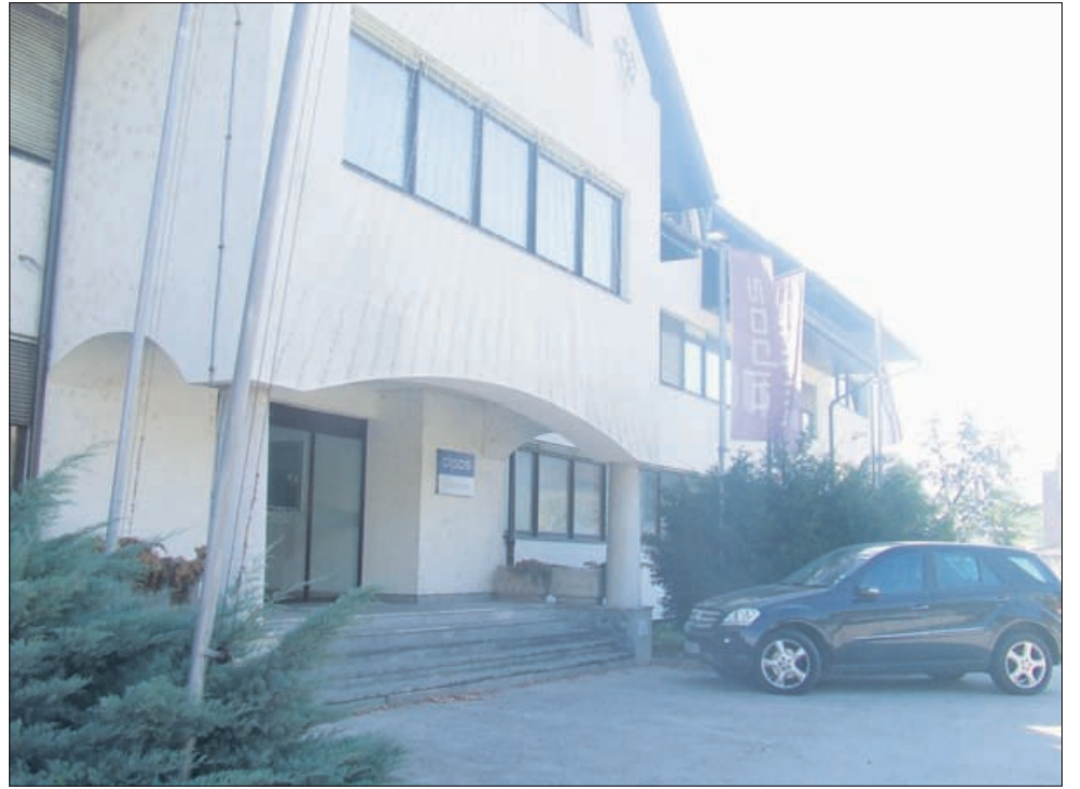
Alposova upravna zgradba

Zaposleni se zavedajo, da bo zaradi pričakovanega stečaja večina izgubila zaposlitev, kar po njihovem pomeni za Kozjansko in občino Šentjur pravo socialno katastrofo: »Pozivamo pristojne državne organe, inštitucije, ki so tudi večinski lastniki bank, da taka negospodarna in škodljiva dejanja bank in njihovih uprav prepreči. Ker