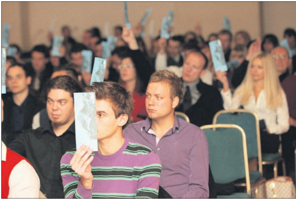
S programskega kongresa Slovenske demokratske mladine, ki je bil v soboto zvečer v Celjskem domu.