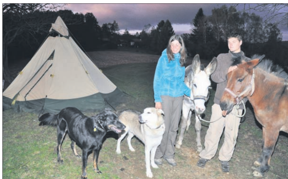
Tu sta preživela noč, nam pa tudi pozirala s svojo »družino«.