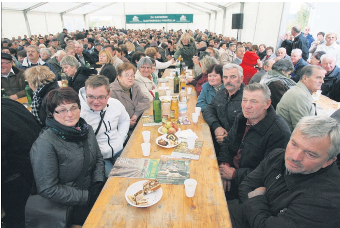
Na Slomu se je vnovič zbralo krepko čez 1000 kmetovalcev.