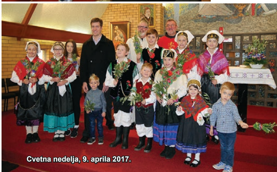
Cvetna nedelja, 9. aprila 2017.