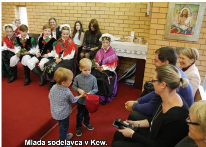
Mlada sodelavca v Kew.

nedeljo so nekatere naše posebnosti v pripravi na praznovanje velike noči. Letos so napletli okrog 180 butaric in prejeli zanje dar $665 (polovico te vsote smo namenili za misijone, druga polovica je za cvetje v cerkvi).