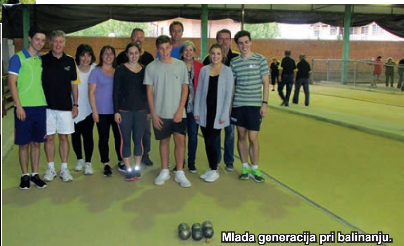
Mlada generacija pri balinanju.

Praznovanje materinskega dne v klubu Triglav je množična zadeva. Že teden pred praznikom je bil vsak kotiček kluba rezerviran do zadnjega stola zunaj na verandi. Družine z