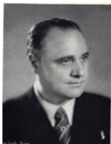
Participando del coro amical Kew - Melbourne 1955