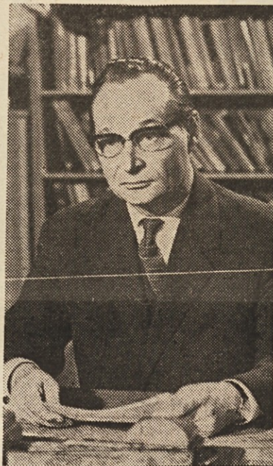
Aleksander Dubček govori po radiu

skrajnežev, ki s svojim početjem spravljajo državo na rob nesreče. Sporočilo graja tudi