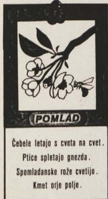
Igra iz letnih časov