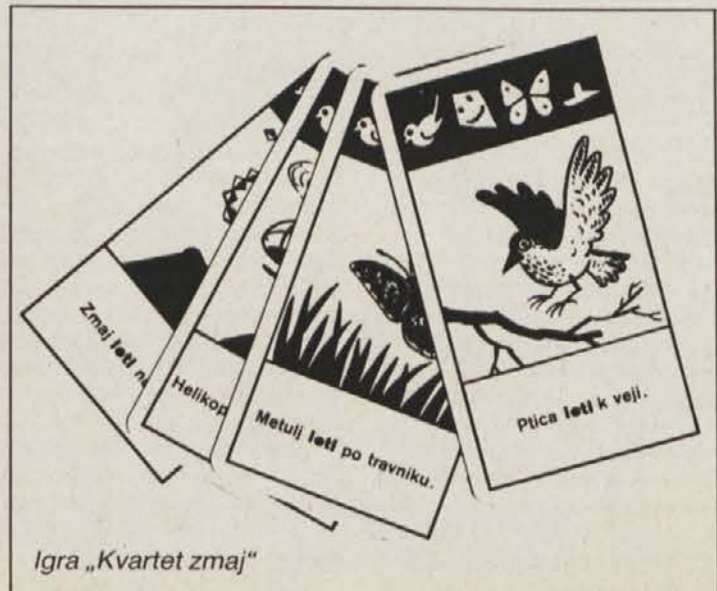
Igra „Kvartet zmaj“