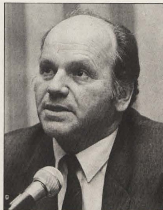
Kandidat Demosa dr. Jože Pučnik

Volilni boj v Sloveniji v zaključni fazi – Nobeden od kandidatov za predsednika ne more računati z absolutno večino