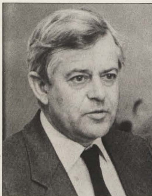
Kandidat ZKS-SDP in SZS Milan Kučan