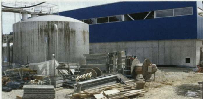
Gradnja osrednjega čistilnega objekta za pitno vodo Šaleške doline na Grmovem vrhu napreduje po načrtih.