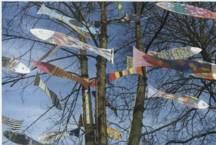
Ribe na drevesu v vrtu Vile Mayer.

N ekoč je bilo jezero, predpomladna krasitev vrta Vile Mayer z otroškimi umetnjami