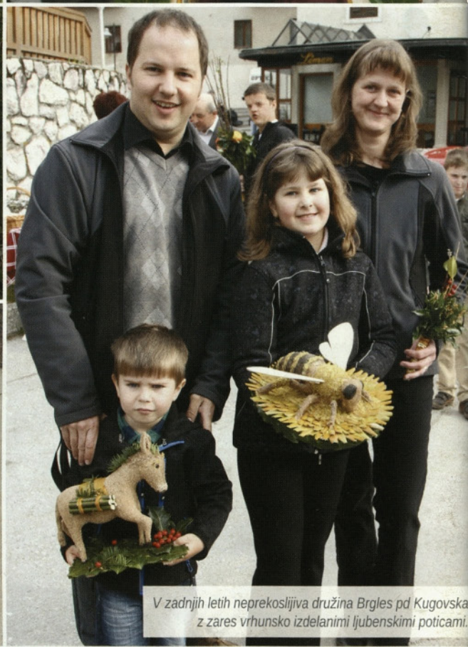
V zadnjih letih neprekosljiva družina Brglesa pd Kugovska z zares vrhunsko izdelanimi ljubenskimi poticami.