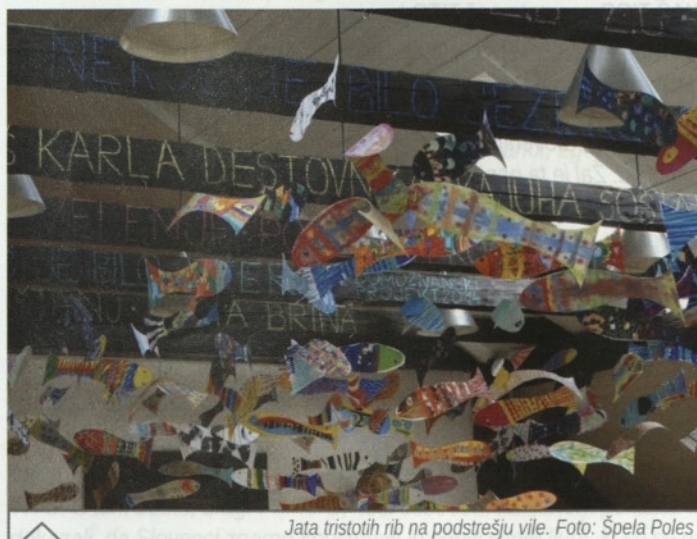
Jata tristoletih rib na podstrešju vile.

Pokrajino je prepravljalo prostrano jezero, »bilo je dokaj globoko in je valovilo ure in ure daleč«. Začenjalo se je v Hudi luknji in končalo v Peniški soteski. Jezersko pokrajino pisatelj imenuje Zalesje, prebivalce Zalesčani. Pripadali so »plemenu zahodnih Slovencev« in živeli v zadrugah na obrežju jezera, v višinskih predelih pa so imeli pašnike. Po jezeru so pluli z velikimi ladjami. Čistili so poganskega boga Velesa, čuvaja čred. Veles je s pastirsko palico krotil pošastnega pozoja, ki je bival v temačnih globinah Zalesčanskega jezera in bil strah in trepet Zalesčanom. Ti so ga s skupnimi močmi premagali tako, da so skopali globok jarek in podrli ogromno skalo v Penku, ki je zadrževala jezero. Jezero je odteklo, nastala je dolina.