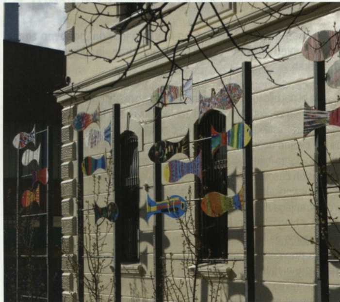
Ribe v vrtu vile.

Soteska Penk se začne pri Puharskem mostu čez Pako in konča na meji z občino Šmartno ob Paki. Domačini pravijo, da je Penk samo na desnem, skornskem bregu Pake. Onkraj reke je že Lokovica. /.../ Pred drugo svetovno vojno so v šoštanjski šoli učili, da je bilo pred dawnimi časi v Šaleški dolini jezero. Mohor in Fortunat sta bila ujetnika, obsojena na smrt. Oprostili bi ju le, če bi prekopala hrib, da bi lahko jezero odteklo. Ujetnika sta se lotila dela in prekopala skalovje na mestu, kjer je danes žaga pri Méšiču. Jezero je odtekalo in se penilo skozi skalo. Od teh pen imo Penk ali Peni graben. Ujetnika naj bi bila v zahvalo upodobljena na oltarju stare škalske cerkve. V Šoštanju je mestna cerkev posvečena sv. Mohorju in Fortunatu. /.../ 2