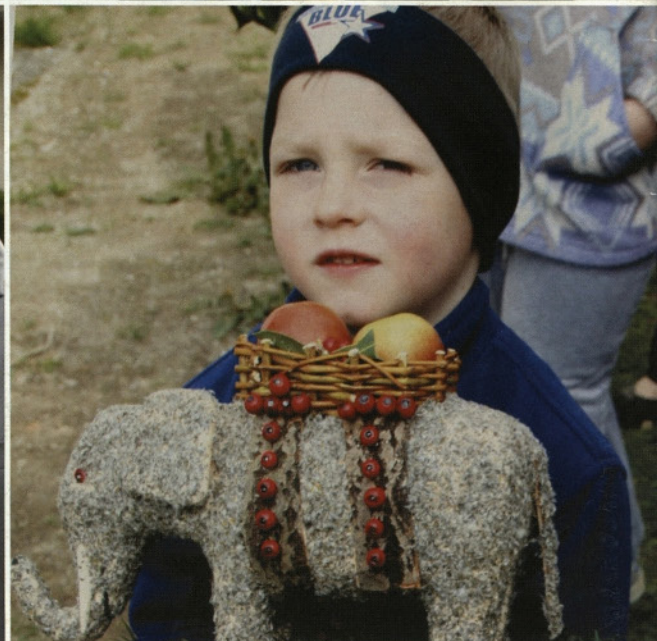
Slonček iz lesa in poslikan z listi in semeni iz narave.