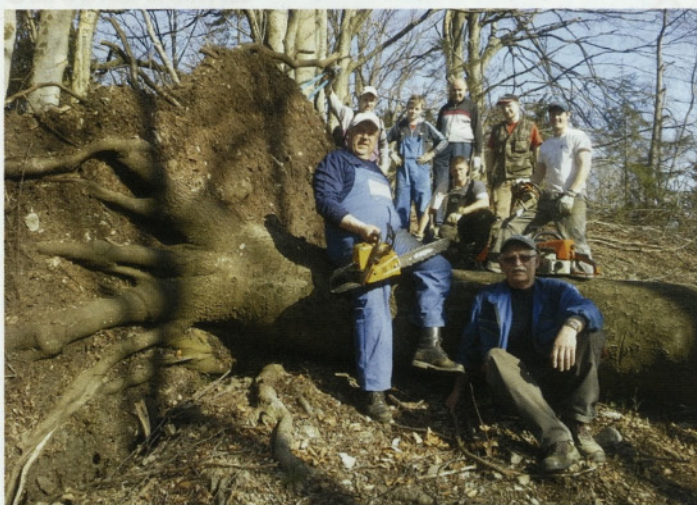
Pridni in marljivi člani ŠD Ravne so poskrbeli, da je Ravenska pot spet prehodna.

Skupina članov ŠD Ravne je v mesecu aprilu izpeljala več akcij urejanja Ravenske poti. Zaradi žleda, ki je uničil kar nekaj dreves, je bila priljubljena planinska pot neprehodna in nevarna.