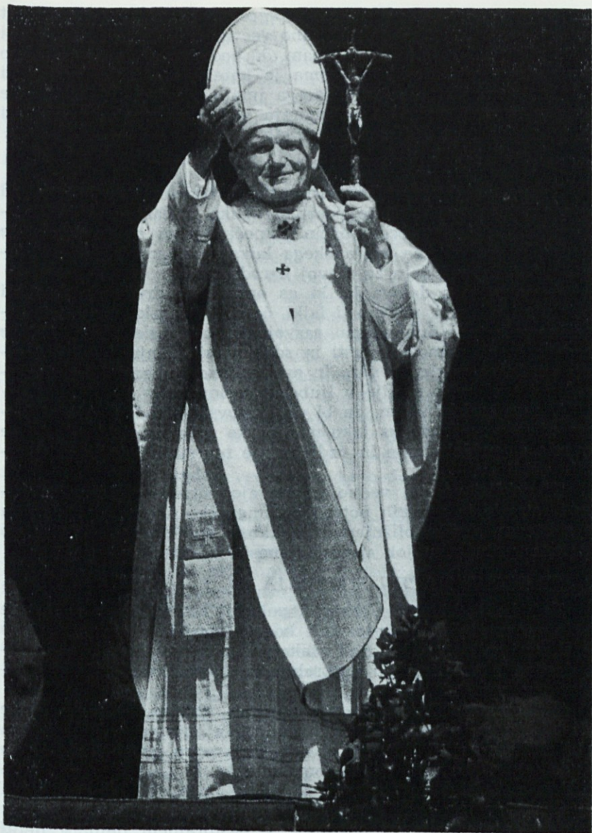
Papež Janez Pavel II. nas na svetovno misijonsko nedeljo vse vzpodbujaja k vztrajnemu misijonskemu sodelovanju.