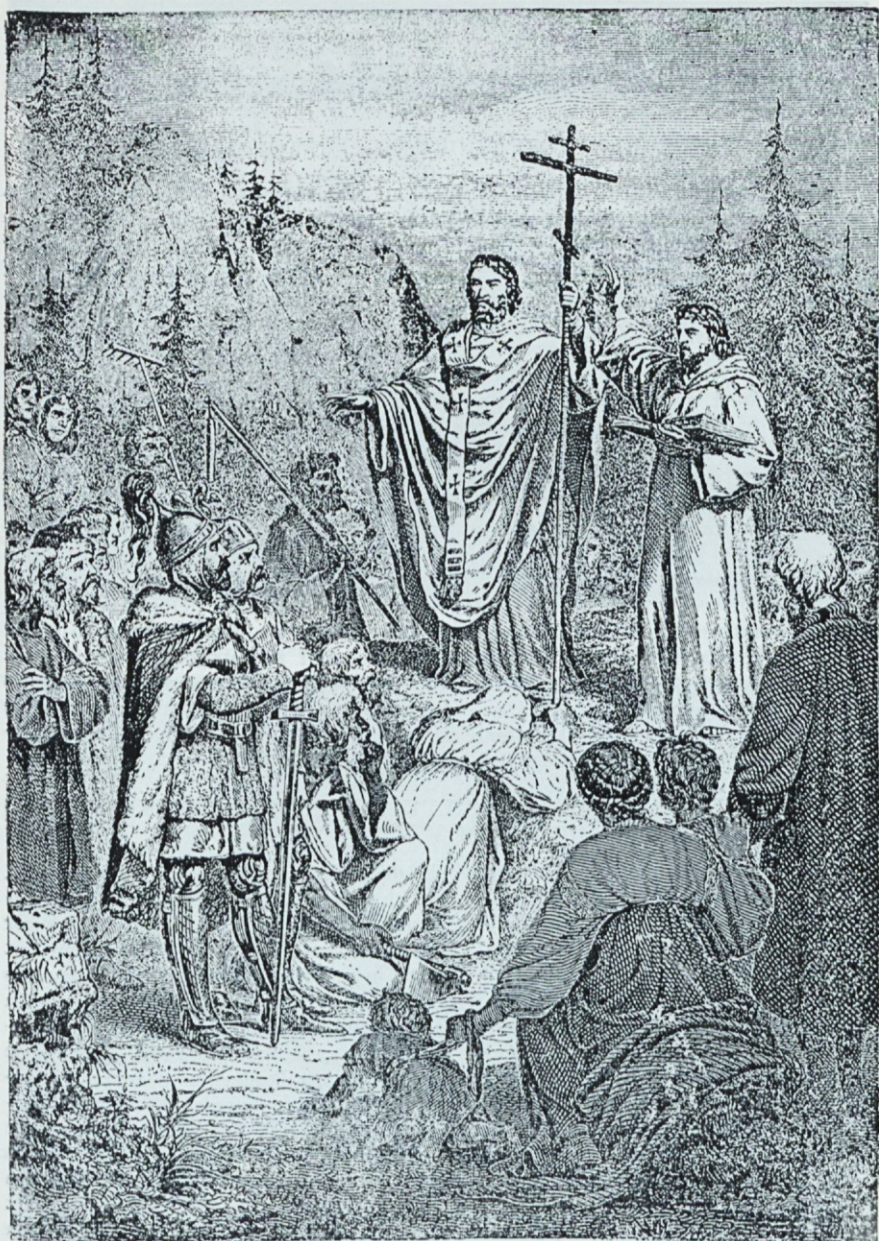
Iz zgodovine pokristjanjenja Slovencev: Ciril in Metod, kot ju kaže stara risarija.