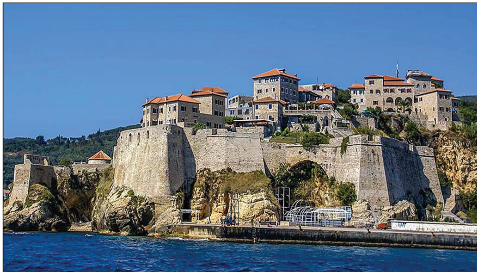
Sl. 1: Srednjovjekovno utvrđenje Ulcinj (Crna Gora), prijestolnica Đurađa II.

nošenjem preko trgovačkih brodova (Blažina-Tomić, 2007, 17). Ova opaka bolest obustavljala je trgovačku djelatnost, stradao je veliki dio stanovništva i izazvane su nagle promjene u svim područjima života Ulcinja.