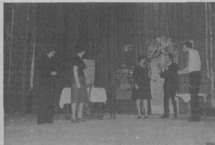
Prizor iz komedije Toneta Partličja Tolmun in kamen, uprizorjene ob 50-letnici Svobode Zalog