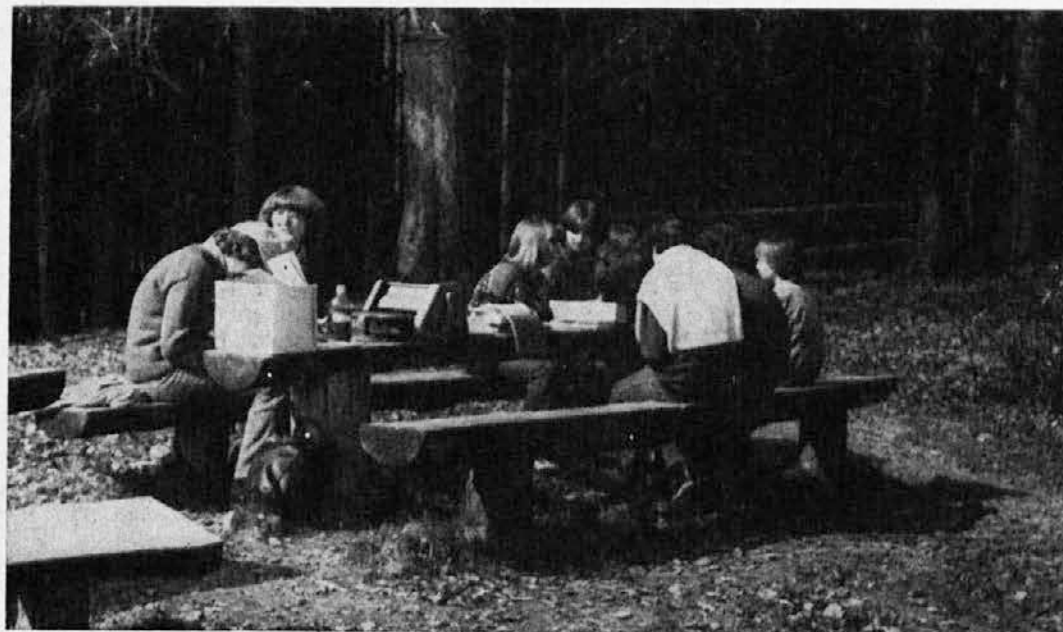
Komisija pripravlja prispevke za glasilo »Samorastniki«

Izvedeli smo tudi za rezultate tekmovalnih skupin.