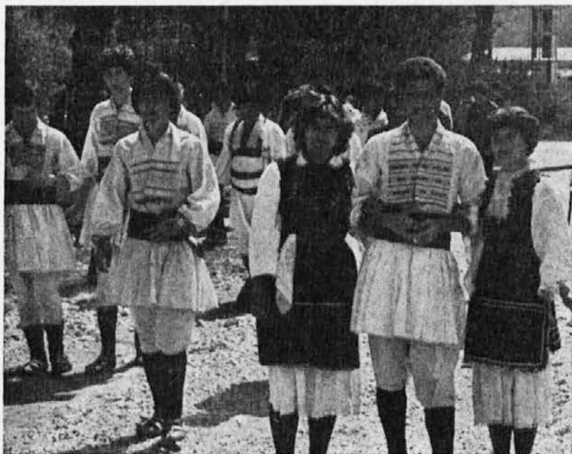
Bratstvo in enotnost

V glavnem se zadovoljimo s TV programom. Gledamo ga, kakršen pač je. Ogleamo si tudi filme, ki jih vrtijo naši kinema-