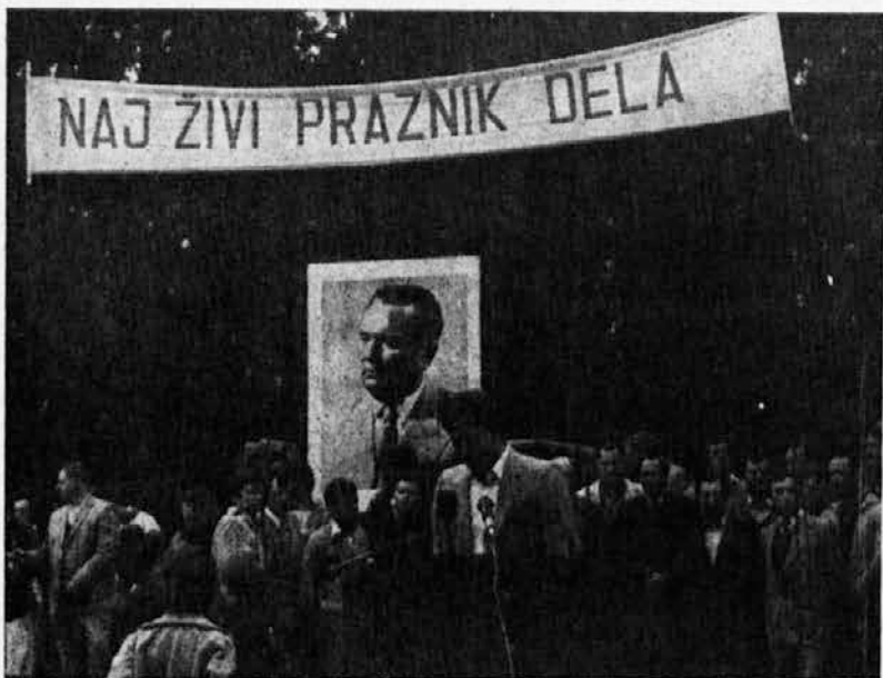
S prvomajskega srečanja železarjev na Navrškem vrhu

Lik drage osebe ostane v srcu. Tako je lik tov. Tita ostal v nas. Povsod nas spremlja, opominja, bodri. Srečni smo, da smo čutili njegovo ljubezen. Odslej na njega spominja vsak cvet, ponovno je v srcih oživela bolečina, ko smo po televiziji gledali modri vlak, ki je s svojim otožnim zvokom nam naznanjal, da je to njegova poslednja pot iz Ljubljane v Beograd. Solze ljudi, pesem »Druže Tito, mi ti se kunemo« naj postane