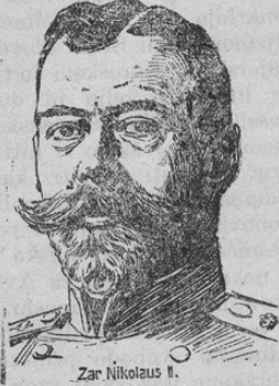
Car Nikolaus II.

Prinašamo sliko bivšega ruskega carja Nikolaja. Revolucija ga je prisilila, da se je moral prestolu odpovedati. Odstopivši car je sin carja Aleksandra III. in carice Marije, neke rojene danske princesinje. Bil je l. 1868 rojen in stoji torej v 49. letu svoje starosti.