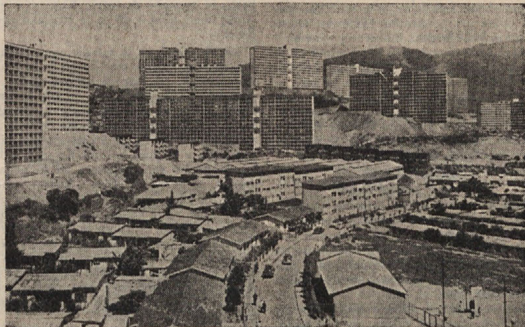
Staro in novo se menjava — tudi v glavnem mestu Venezuele Caracas. Ze v kratkem času bodo enonadstropne hiše, ki so na sliki spredaj, nadomestili z moderno urejenimi nebotičniki. Vse te hiše, ki rastejo iz tal kot gobe po dežju, so po 15 nadstropij visoke in nudijo prostor za stanovanje približno 1000 osebam. Sedaj je v načrtu gradnja še 40 takih nebotičnikov. (AND)

Prav je, da se tudi mi spomnimo tega duhovnega velikana modernega časa.