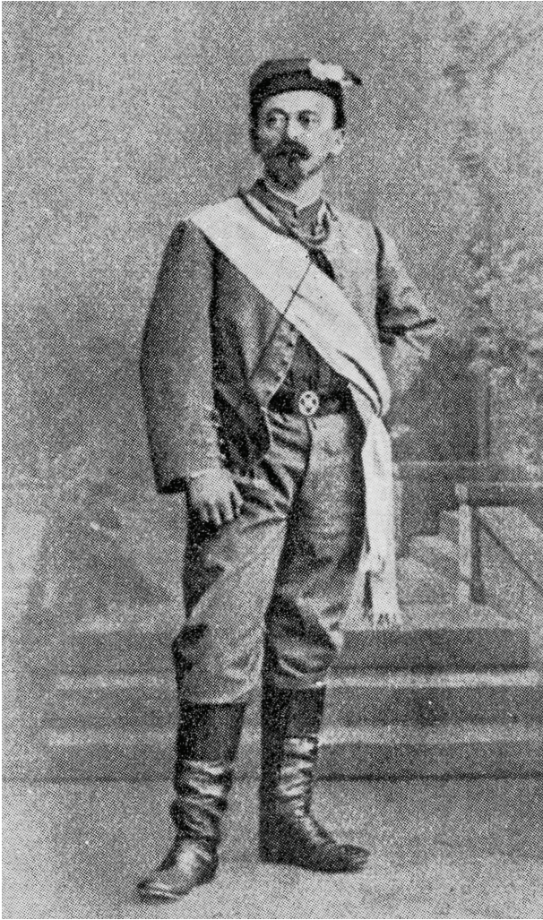
Dr. Miroslav Tyrš, utemeljitelj sokolstva, v slavnostnem kroju čeških Sokolov, 1882. leta.