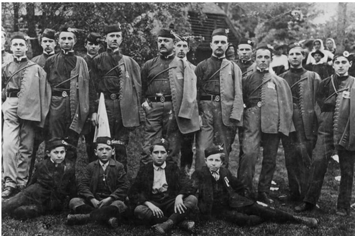
Sokolsko društvo iz Središča ob Dravi, 1919. leta.