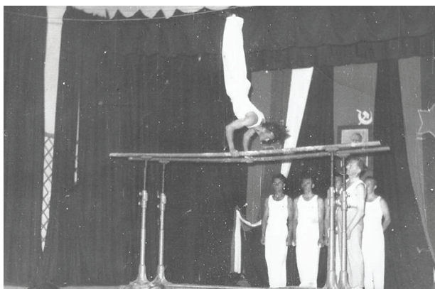
Telovadni nastop, 1965. leta.

Najbolj množična je bila vsakoletna splošna telesna vadba v Sokolani, ki je služila pripravi orodnih telovadcev (razdeljenih v kategorije po starosti: otroci, pionirji, mladina, člani, starejši člani – za moške in ženske) na razna tekmovanja in manifestacije. Najpomembnejše so bile telovadna akademije, izpeljane v Sokolani, datumsko pa vezane na krajevni praznik (začetek aprila) in letni nastopi (povezani s koncem šolskega leta) na zunanjem telovadišču med Sokolano in osnovno šolo. Rezultati iz okrajnih tekmovanj in mnogobojev v orodni telovadbi, pa tudi v plavanju in odbojki, vsi iz začetnega obdobja delovanja, dokazujejo, da se je v središkem Partizanu delalo zelo dobro in množično. Leta 1954 je npr. na republiški zlet v Ljubljano odpotovalo 19 telovadcev, leto kasneje pa podatki govorijo kar o 107 članih društva, ki so na pokrajinskem zletu v Celju predstavljali t.i. proste vaje. Društvo je skrbelo tudi za primerno izobraženost svojih telovadcev, ki so jih redno pošiljali na razna izobraževanja, vse z ciljem zagotoviti čim kvalitetnejšo in varno vadbo. Tudi pri štafeti mladosti, vsako leto potekajoči med Središčem in Ormožem, je imel Partizan aktivno vlogo. V vzponu je bila tudi atletika – z okrajnih mnogobojev so središki atleti prinašali