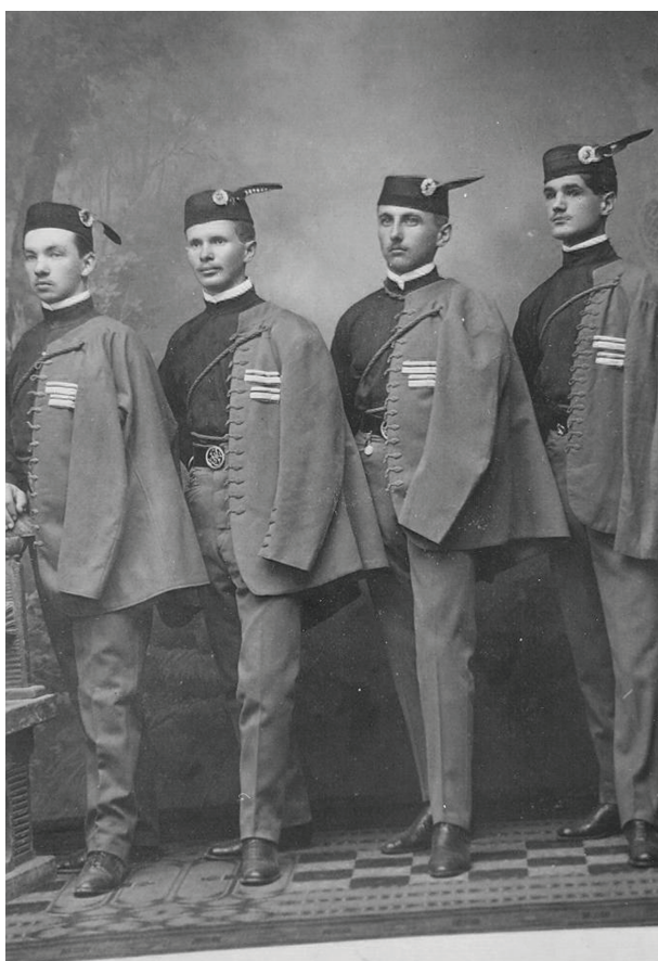
Člani središkega Sokola, leta 1911.