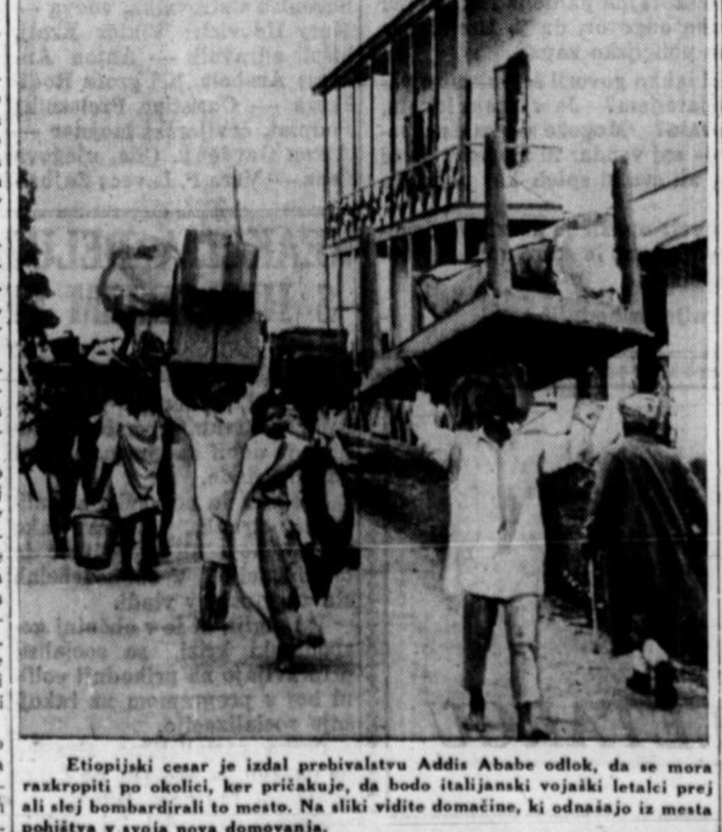
Etiopijski cesar je izdal prebivalstvu Addis Ababe odlok, da se mora razkropiti po okolici, ker pričakuje, da bodo italijanski vojski letalci prej ali slej bombardirali to mesto. Na sliki vidite domačine, ki odnašajo iz mesta pohištva v svoja nova domovanja.