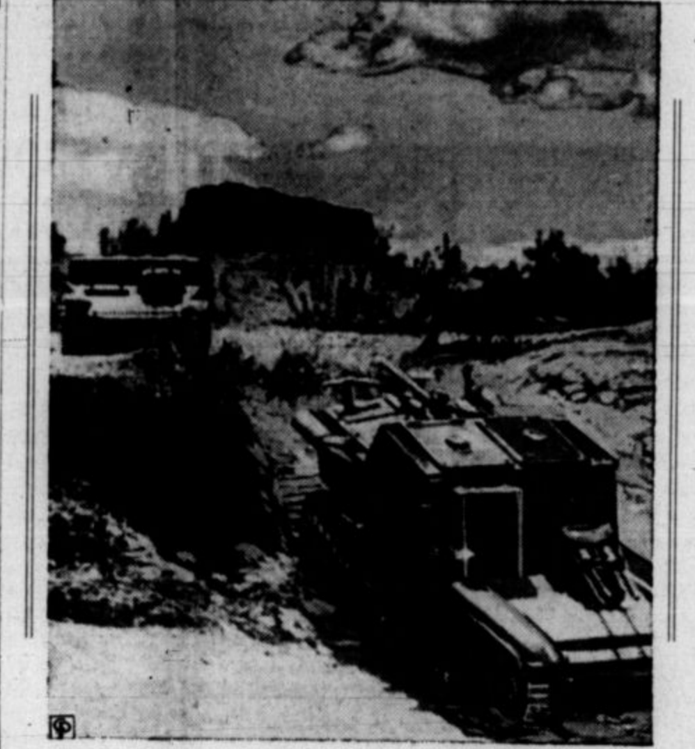
Stroji za ubijanje na debelo, ki kose Etiopijce.