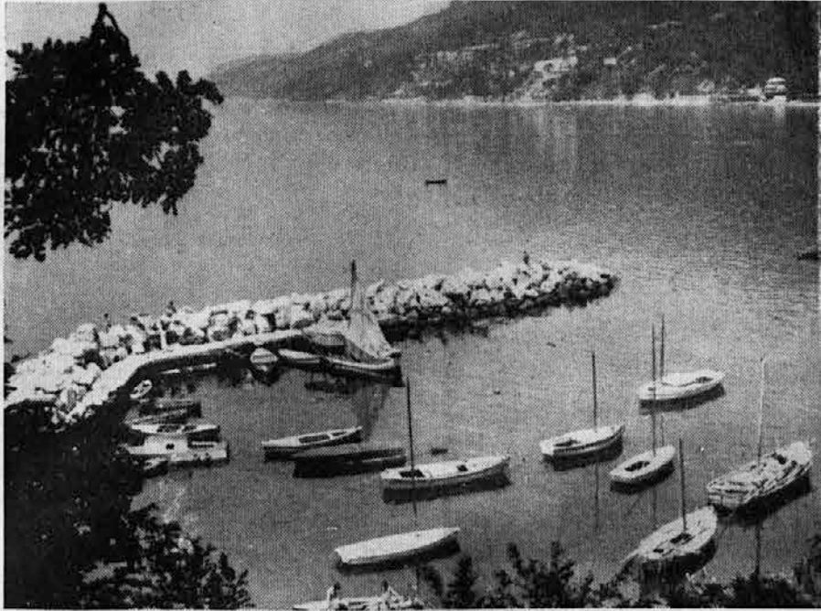
PORTIČ V GRLJANU

V sredo popoldne se je vrnil v Beograd, kjer je imel govor. Prihodnje dni bo imel razgovore z Nasserjem.