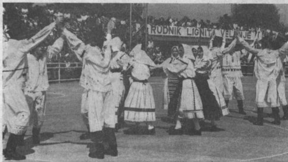
Letos je rudarski ceremonial na kotalkališču popestrila šaleška folklorna skupina