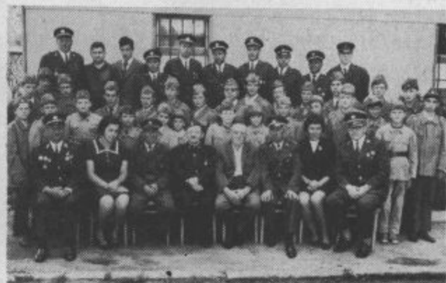
Gasilci industrijskega društva rudnika lignita Velenje