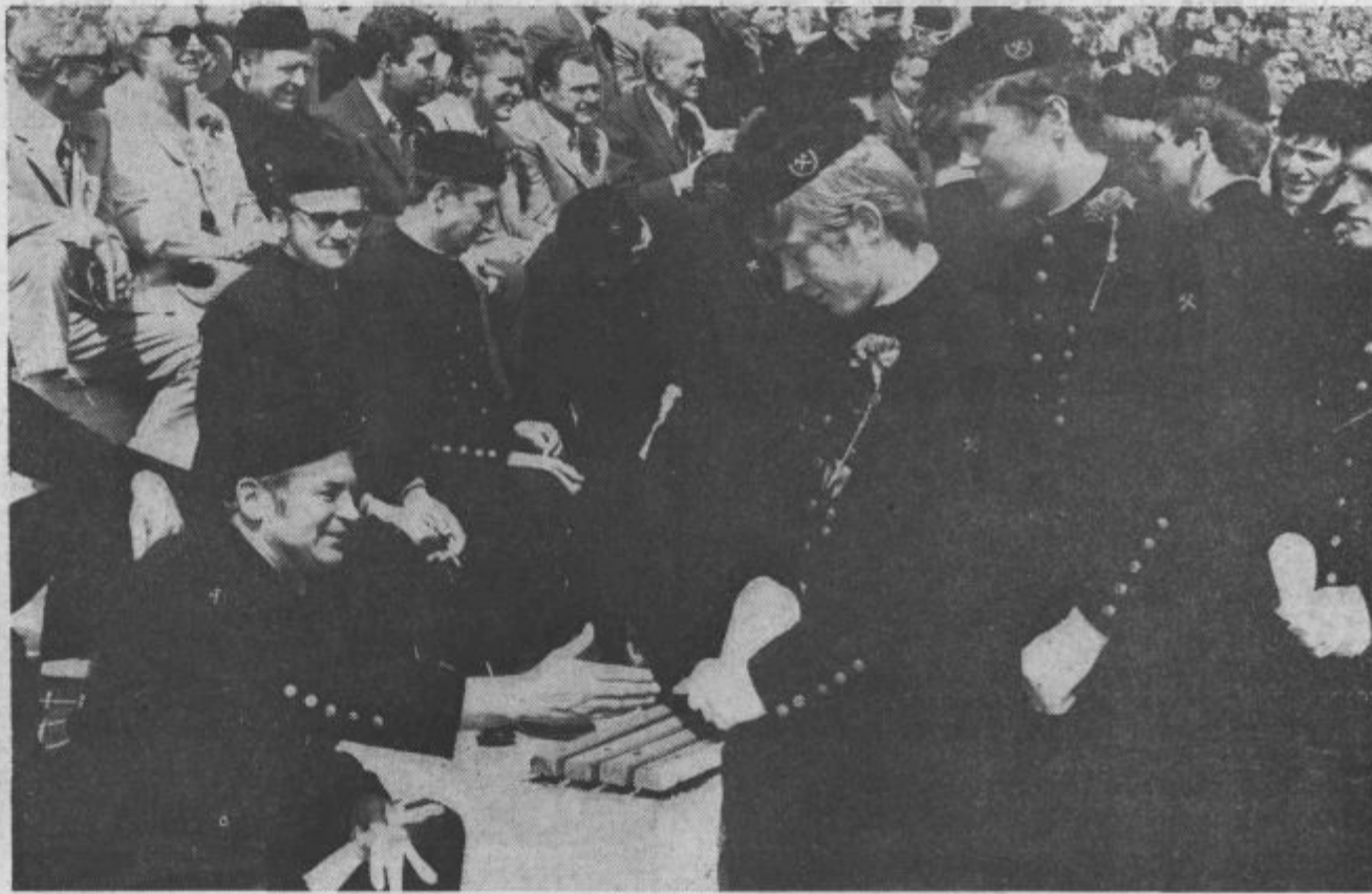
Stisk roke in starejši rudarji so sprejeli novince v svoj stan