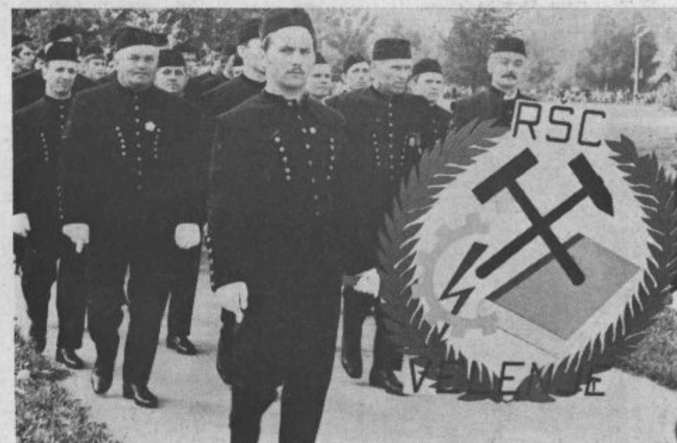
Kolektiv šolskega centra