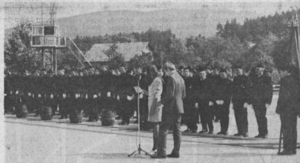
Mladi rudarji predno so skočili čez kožo