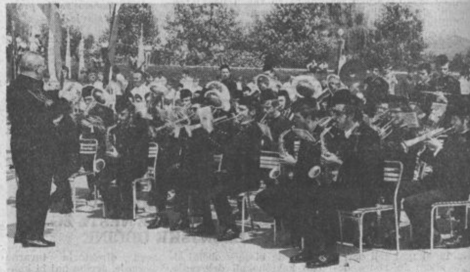
Mladinska godba šolskega centra