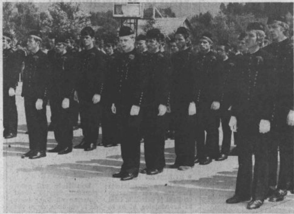
Letos je rudarsko poklično šolo končalo 87 učencev, 25 dijakov pa je diplomiralo v rudarski tehniški šoli