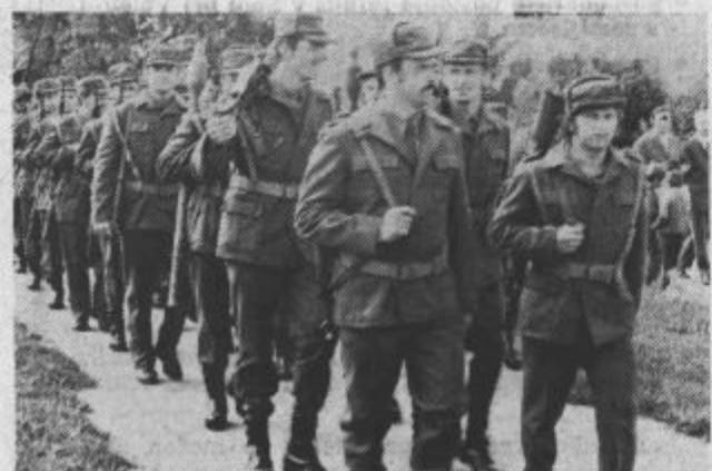
Naša teritorialna vojska