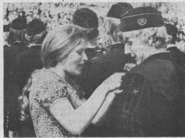
Absolventi rudarske šole so predali ključ in rudarsko svetilko (zgoraj), dekleta pa so pripela »ljubezen« (spodaj) — rudarji pravijo, da brez te ne gre v rudarskem poklicu.