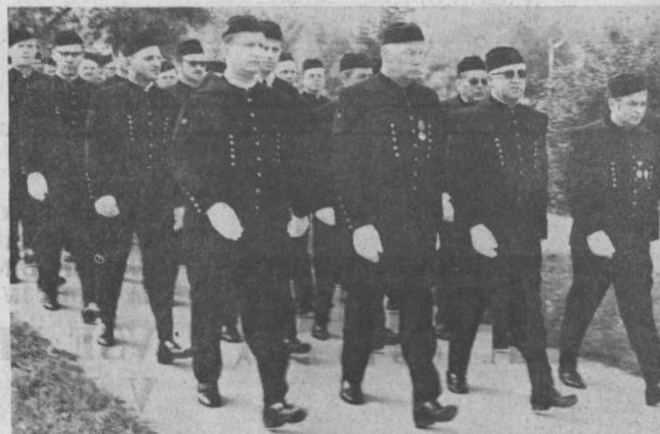
Za rudarski praznik se rudarji oblečejo v svečana črna oblačila in v sprevodu korakajo po velenjskih ulicah