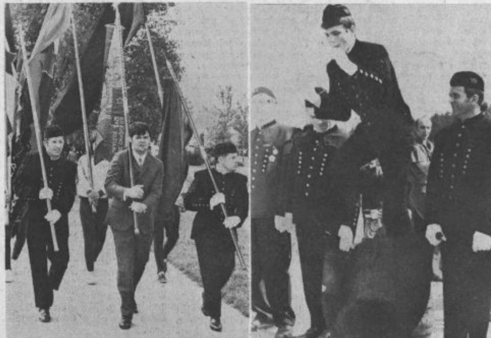
Rudarska zastava, trobojnice in prapori na čelu rudarskega sprevoda (levo). Skočil je čez napeto kožo in postal rudar (desno)