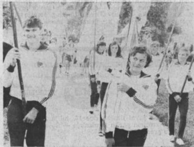
Atletiči iz Velenja v rudarskem sprevedu