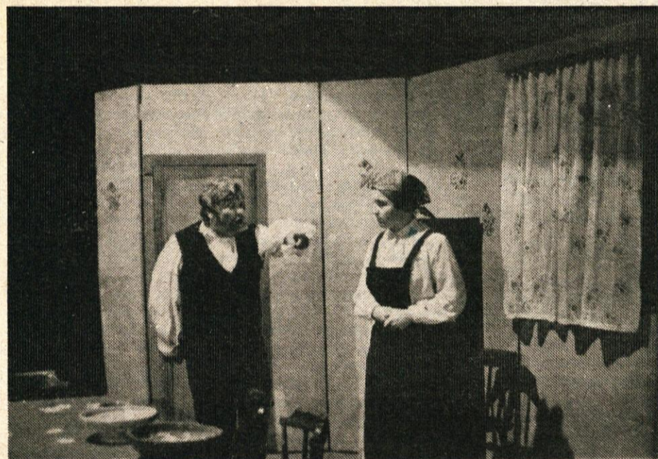
Gospodinja Urša je bila vedno tarča neusmiljenega gospodarja Matevža

Našim kulturnikom želimo veliko uspeha in v naslednji sezoni na svidenje!