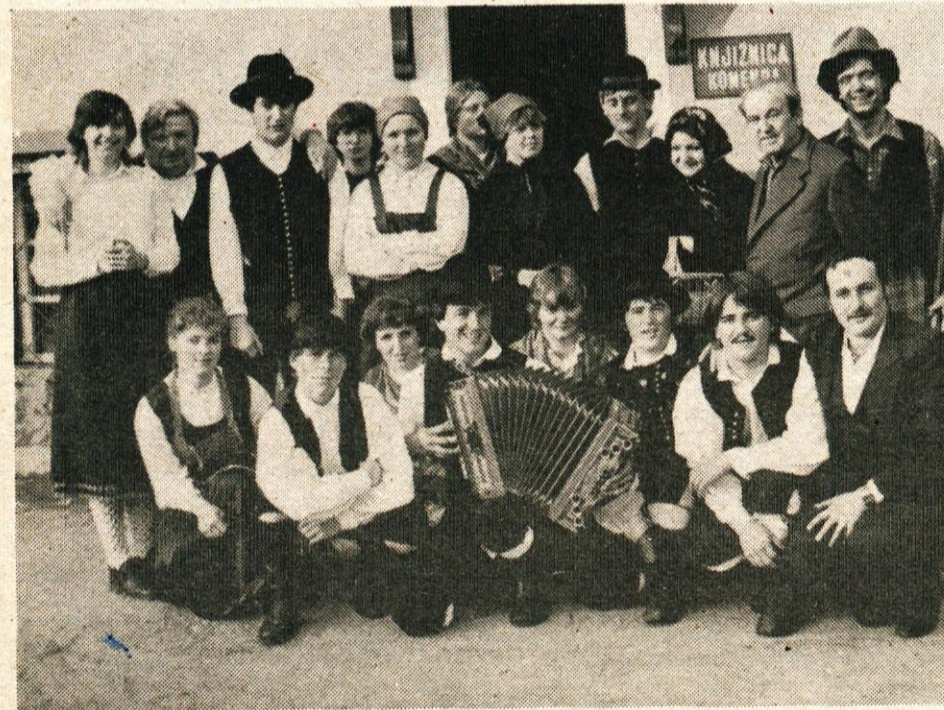
Igralci in tehnično vodstvo so bili zadovoljni po napornih predstavah