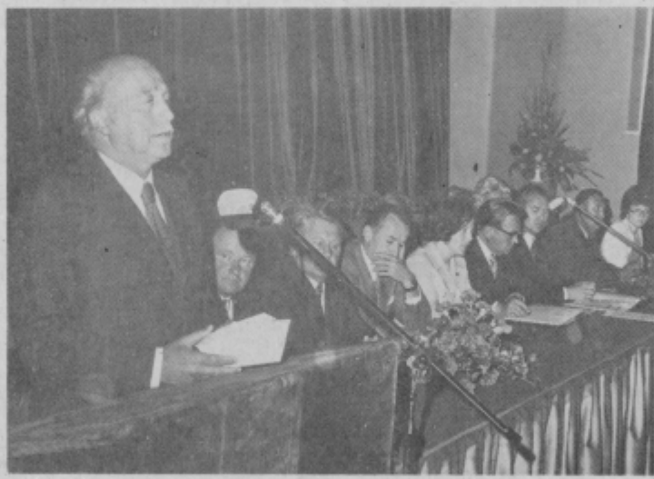
Mitja Ribičič, predsednik republiške konference SZDL Slovenije govori Ormožanom in zbranim gostom.

„700-letnica ni samo praznovanje jubileja, temveč je praznik naših delovnih zmag, naše zgodovinske