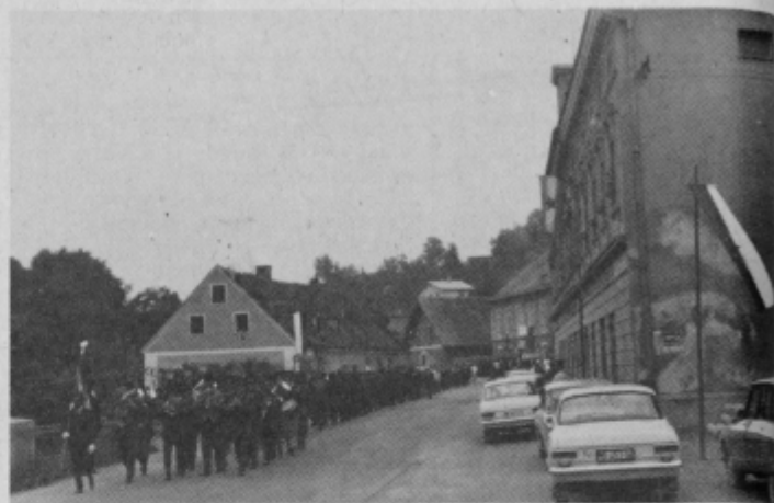
Povorka na poti

Kljub temu, da so se prebivalci krajevne skupnosti Poljčane že daljše obdobje pripravljali predvsem na praznovanje 400 obletnice slovensko-hrvaških kmečkih uporov pa niso zamenjali pomena svojega že 18. krajevnega praznika, ki ga imajo 17. junija, pa so ga letos zaradi osrednje proslave v Štatenbergu proslavili že v soboto, 16. junija 1973.