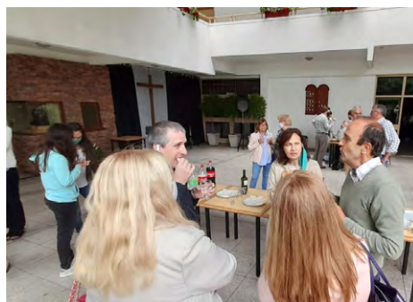
Slovo na Pristavi