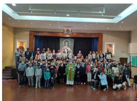
Slovo v Slomškovo domo