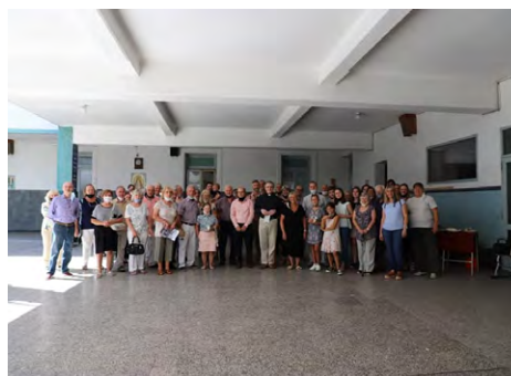
Slovo v San Martinu