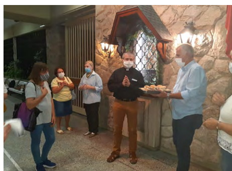
Slovo v Našem domu San Justo