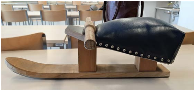
Novější tip pležuha, ki ima za osnovo smučko in oblazinjen sedež, kar pripomore k udobju in varnosti.