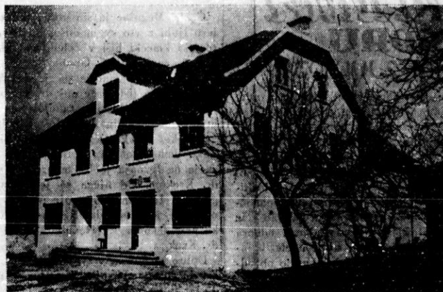
Novi Prosvetni dom v Križah.