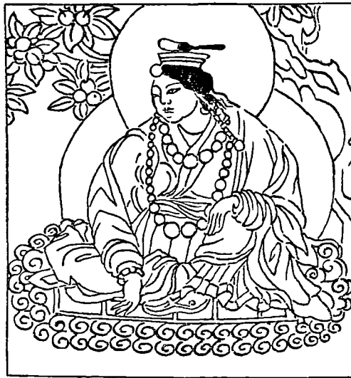
Abbildung 1. Die Königin aBroñ-bza byañ-c'ub sgron.