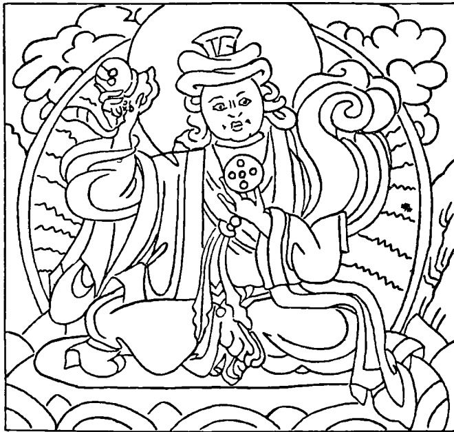
ཁམས་གསུམ་དབང་སྲུང་གུ་ཅ་པ་རྣམ་རྒྱལ།