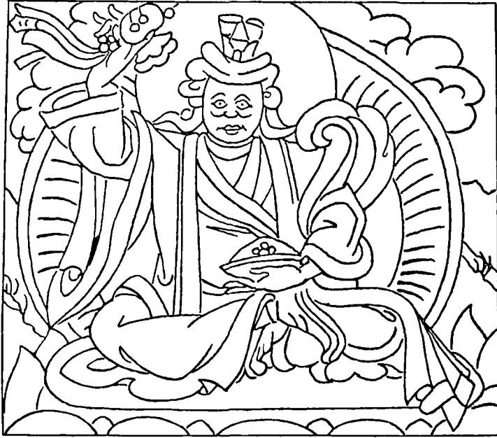
མཁུན་རབ་དབང་ཕུག་ལྷོ་ལྷན་མཚོག་སྲིད་ཅུལ།