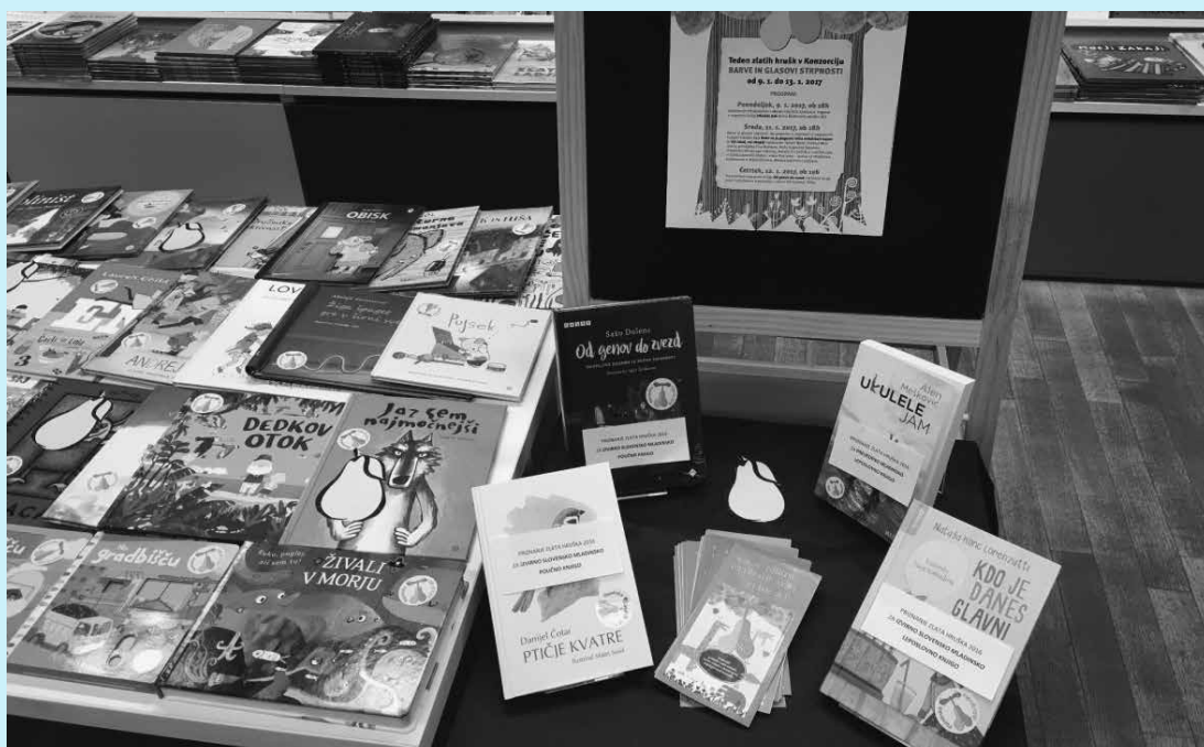
Razstava knjig, nagrajenih z zlato hruško, na mladinskem oddelku knjigarne Konzorcij