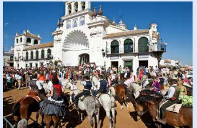
Romanje El Rocío

Cilj letošnjega izleta članov vrhniške zbornice bo pokrajina Andaluzija na jugu Španije. Letalo v obe smeri. Termin od 15. do 19. maja , to je v času znamenitega flamenco dogodka. O podrobnostih boste člani obveščeni pravočasno, po e-pošti.