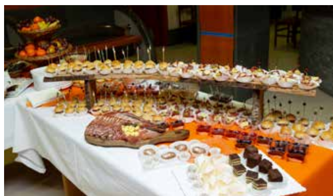
Dogodek se je zaključil s pogostitvijo in druženjem v avli Kulturnega doma