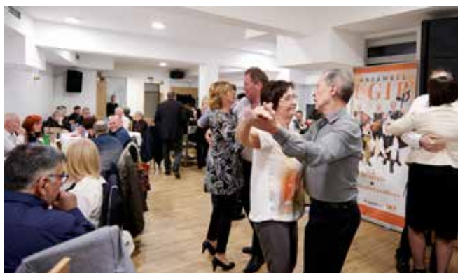
Vrteli smo se do poznih jutranjih ur