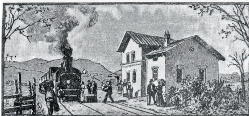
Bahnhof von Jarsche-Mannsburg.

Kot pravijo, je sedanji vozni red vlakov na kamniški progi kar najbolj oblikovan v skladu z željami potnikov, ki pa lahko svoje predloge in