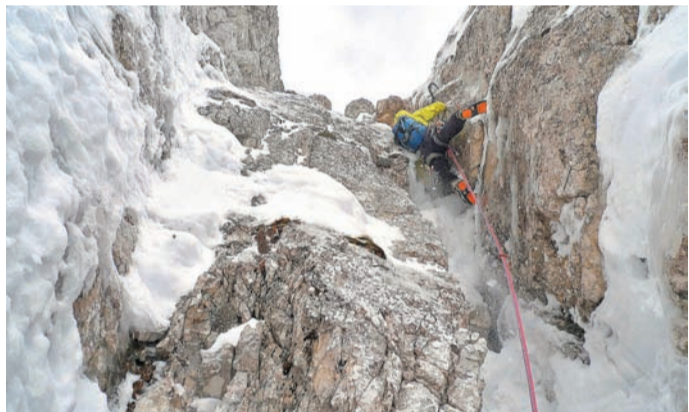
Iz Grape med Travnikom in Šitami