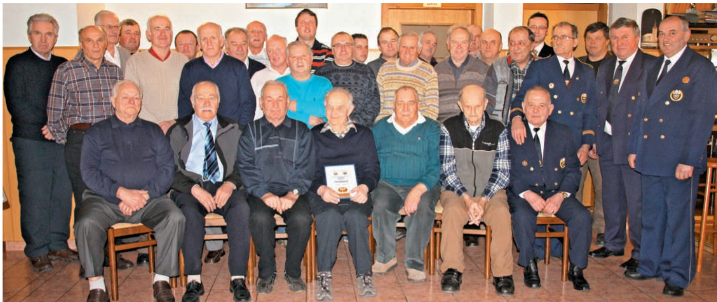
LETNI OBČNI ZBOR ZŠAM KAMNIK