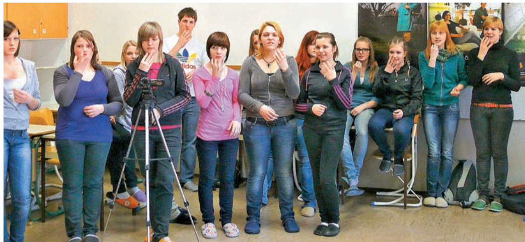
Na kamniški Srednji ekonomski šoli - smer PREDŠOLSKA VZGOJA že osvajamo osnove znakovne govornice dojenčkov.

Znakovno sporazumevanje - inovativni mednarodni projekt, v katerega se je kot edina slovenska srednja šola s področja predšolske vzgoje vključila tudi Srednja ekonomska šola ŠCRM.