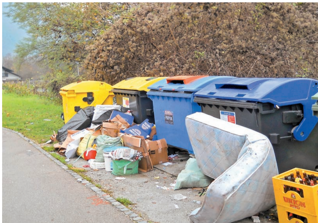
To je le eden izmed onesnaženih ekoloških otokov v naši občini. Brezvestneži ob zabojnikih odlagajo vreče in zaboje odpadkov, ki tja ne sodijo, ter nepravilno odlagajo odpadke, kot so nevarni odpadki, žimnica ...

V podjetju Publicus redno obveščajo uporabnike njihovih storitev o pravilnem ločevanju in odlaganju komunalnih odpadkov, tako na mesečnih računih kot na straneh Kamniškega občana in Aplence. Kot napovedujejo, bodo tam, kjer bodo zaznali večje kršitve nepravilnega odlaganja odpadkov, o tem obvestili pristojne občinske službe, ki imajo edine možnost sankcioniranja kršiteljev. »Z naše strani lahko uporabniki, ki bodo nepravilno ločevali odpadke, pričakujejo predvsem opozarjanje v smislu obvestil o nepravilno odlaganju odpadkov. Kjer se bo nepravilno ravnanje ponavljalo, bomo o tem ponovno obvestili pristojne ob-