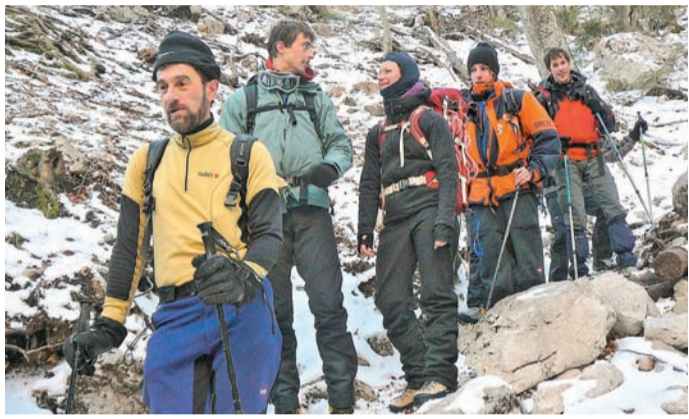
Udeleženci AŠ med sestopom s Kokrškega sedla