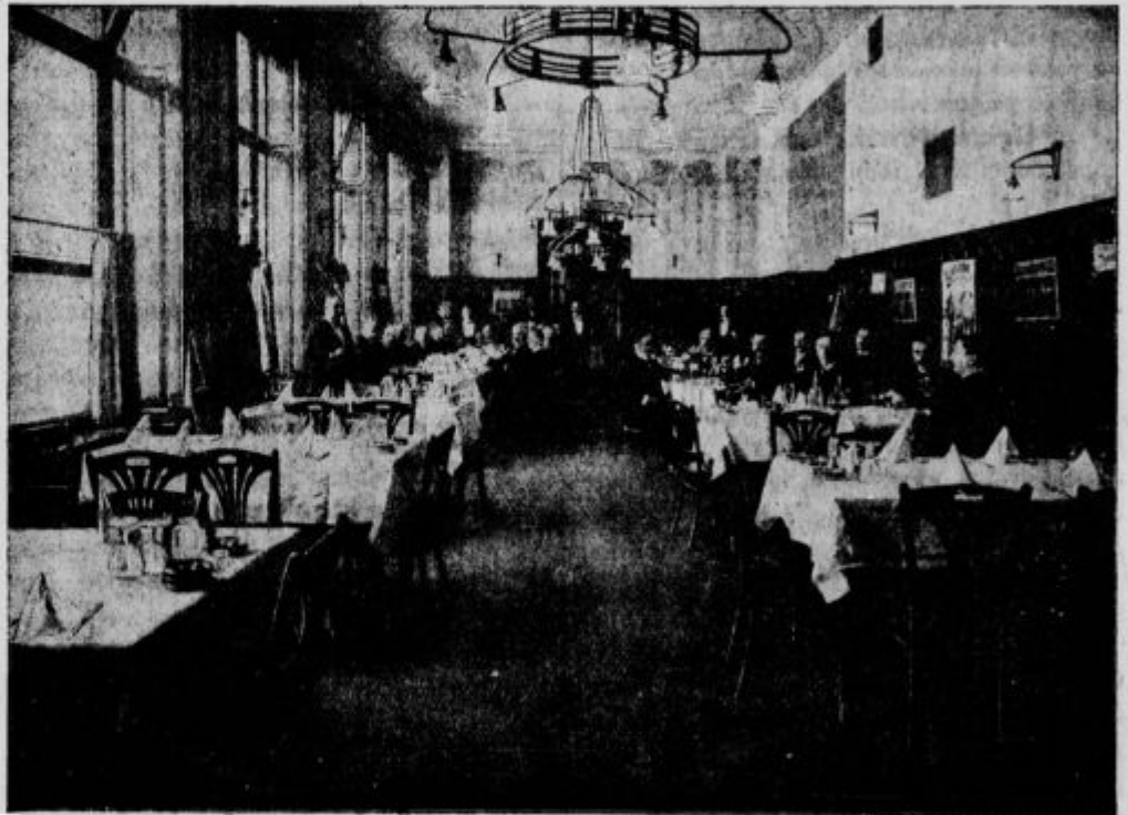
Restavracija v hotelu „Union“ v Ljubljani.