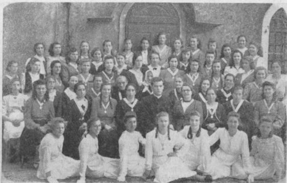
Marijina družba: Verpogliano di Vipacco. (Glej dopis!)

Toda če ima bolnik na smrtni postelji dosti časa, da se na smrt pripravi, si že še pomaže, če je za to potrebo poučen, kako si mora pomagati. Vprašanje je le, če ljudje vedo, kaj je po-