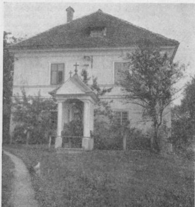
V varstvu Srca Jezusovega. (Znamenje ob župnišču na Rudniku pri Ljubljani.)

Druga devetdnevnic je pa »t r a j n a«, to