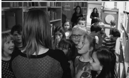
Sliki 7 in 8: Sprehod po knjižnici in predstavitev literature o praznikih

Izjemno pomemben cilj KIZ je učenca usposobiti kot samostojnega iskalca literature v šolski knjižnici, zato se mi je zdelo smiselno preveriti, kako učenci ocenjujejo svojo zmožnost iskanja literature. Vpeljala sem element formativnega spremljanja, s katerim bi učenci oblikovali kriterije uspešnosti za iskanje literature v šolski knjižnici (Holcar Brunauer