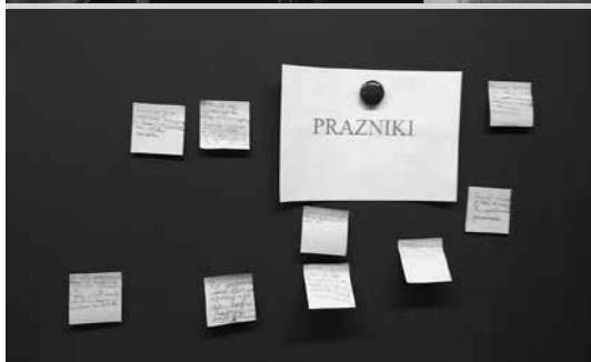
Sliki 4 in 5: Asociogram in nameni učenja

Uro sem nadaljevala z jasnim vključevanjem specifičnih ciljev in vsebin, ki jih morajo učenci pri urah knjižničnega informacijskega znanja (KIZ, 9, 10, 11) usvojiti v prvem VIO, in sicer spoznati osnovno vsebino knjižnične zbirke, starostni stopnji ustrezno zbirko knjižničnega gradiva ter poučno gradivo za