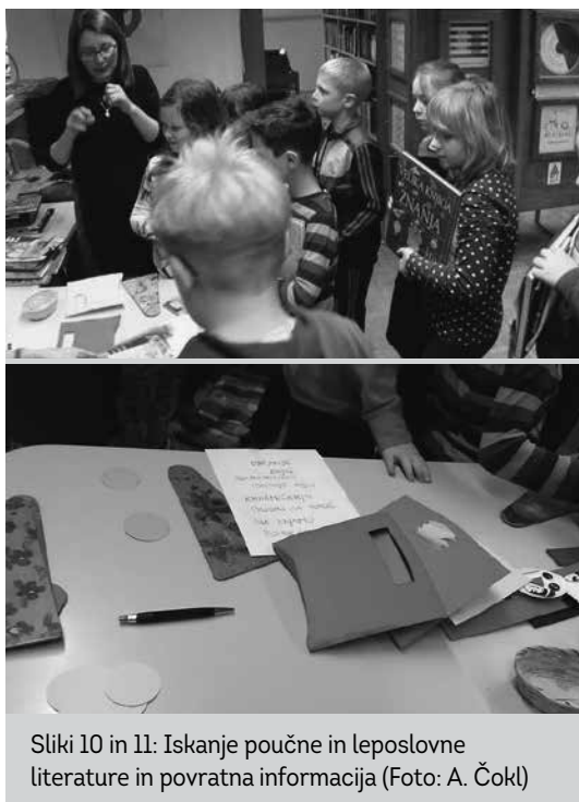
Sliki 10 in 11: Iskanje poučne in leposlovne literature in povratna informacija

Vpeljevanje elementov formativnega spremljanja v knjižnici v preteklem letu je obrodilo sledove.