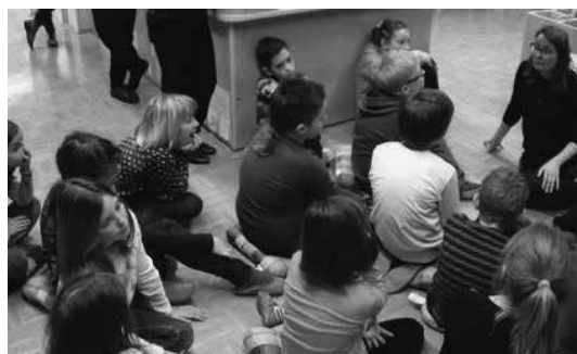
Slika 6: Viri v šolski knjižnici

pridobitev stvarnih informacij. Učenci v prvem VIO poznajo osnovne vrste knjižničnega gradiva – periodiko, knjigo, zvočno knjigo, DVD, zgoščenko – in znajo te vire v skladu s starostno stopnjo tudi uporabljati. Za obuditev tega znanja sem jim pripovedovala meditativno zgodbo o reki, ki od svojega izvira teče skozi naravo, vasi in mesta, srečuje ljudi in se ves čas uči, bogati z življenjskimi izkušnjami. Ob poslušanju zgodbe so razmišljali o razno-terih virih, ki jih lahko poiščejo v knjižnici in uporabijo za poglobljanje in razširjanje znanja, kar prikazuje slika 6.