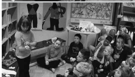
Slike 1, 2 in 3: Predstavitev prazničnih predmetov