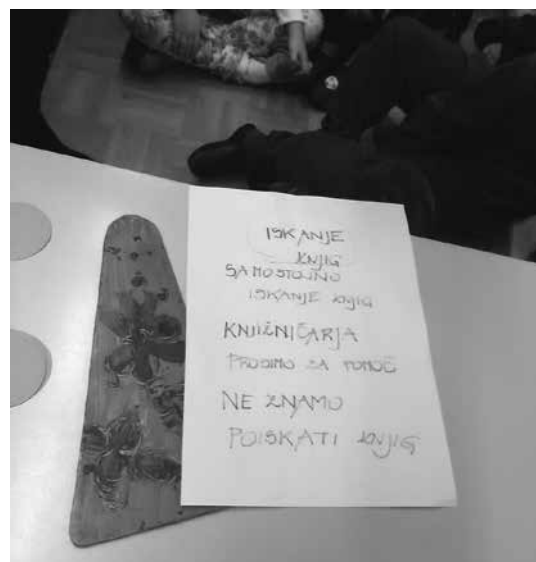
Slika 9: Kriteriji uspešnosti iskanja literature